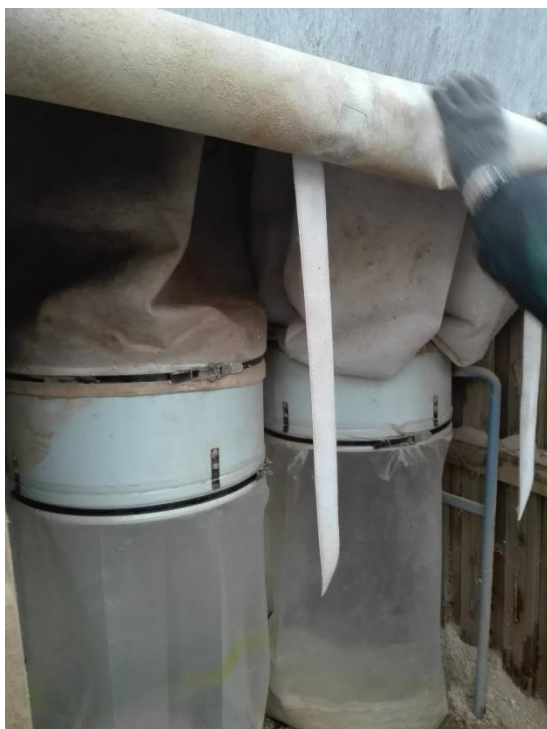
Posefiltre, i alt 4 enheder. Poser tømmes efter behov.