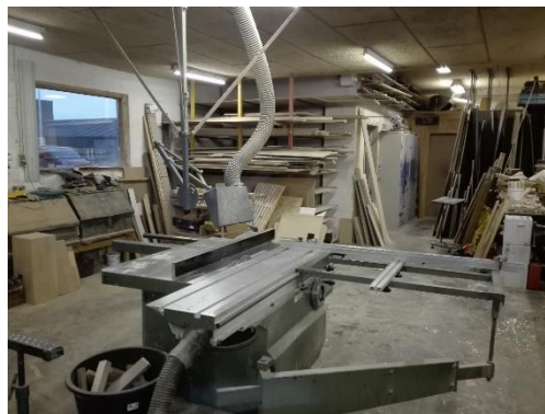
Sav i tømrværksted.