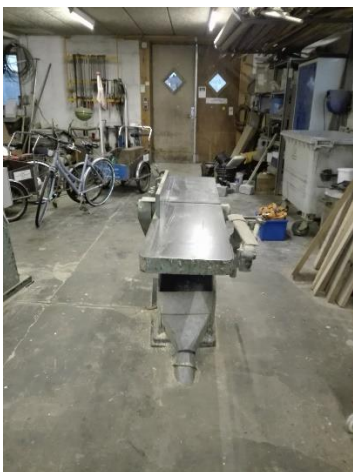
Træbearbejdning i tømrværksted.