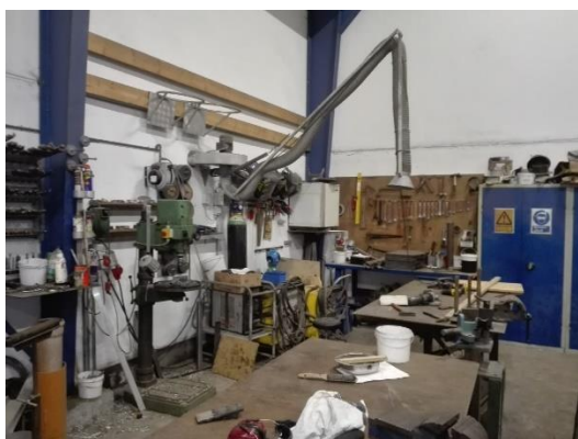
Svejerøgsudsug i lagerhal.