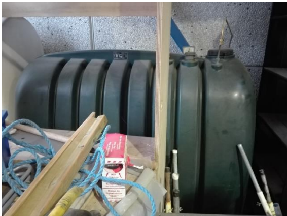
Plastolietank til oliefyr i lagerhal.