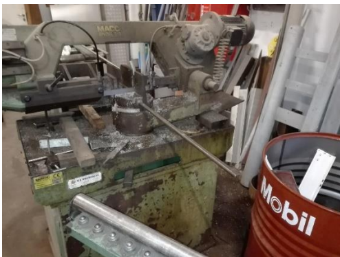
Sav i lagerhal, hvor olie kører i lukket system.