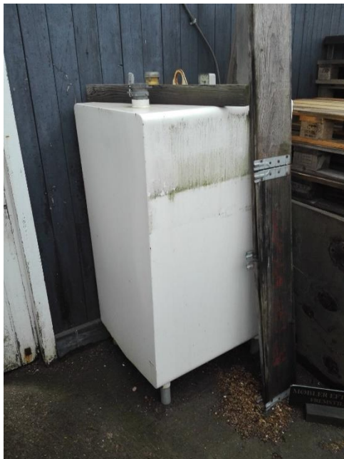
Ståltank, 600 liter, til opvarmning af tømrværksted.