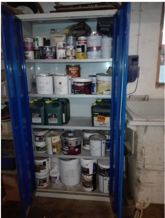
Skab til opbevaring af maling, herunder malingsrester.