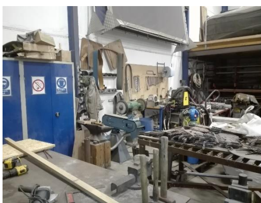
Slibemaskiner til metal i lagerhal.