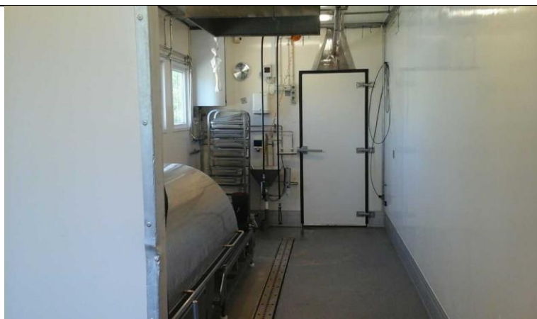
Skoldekar og brænding inden grisene via transport i loftet føres ind i fryse-/kølerum.