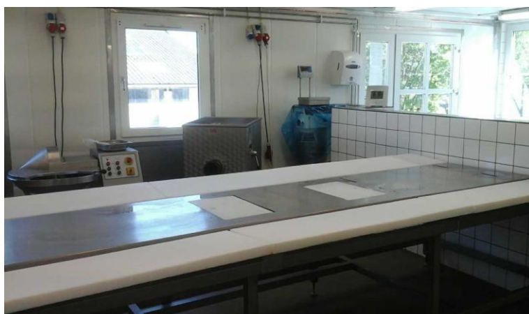
Opskæring og partering af grisene. Til højre bag muren sker der udlevering af bestilt kød.