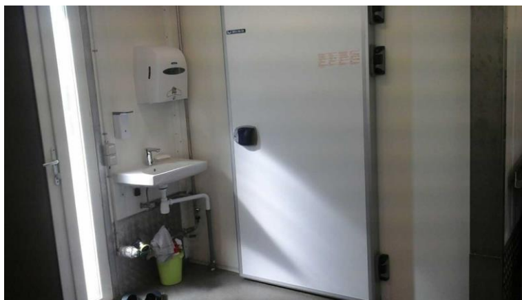
Dør ind til det første fryse-/kølerum – slagteriet har to fryse-/kølerum.