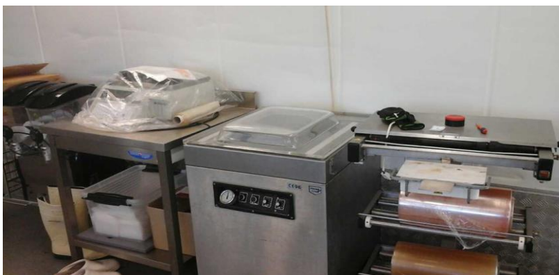
Pakning af færdigvarer.