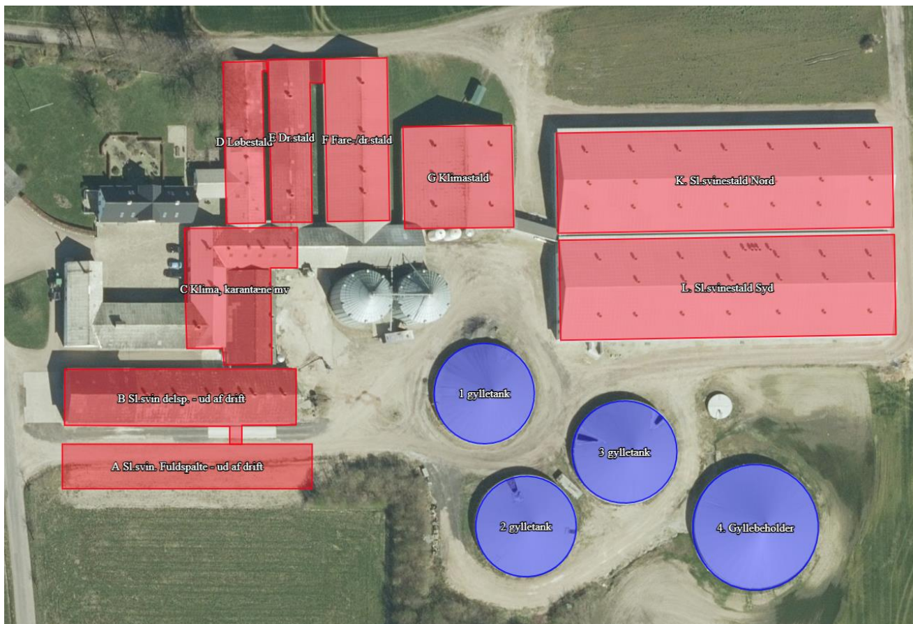
Figur 3. Oversigtskort over produktionsanlæg på Knudsbølvej 36, Jordrup.

IE-husdyrbruget på Knudsbølvej 36, Jordrup påbydes i henhold til § 39, jævnfør § 41 og § 43 a i Husdyrbrugloven følgende vilkårsændringer i forhold til godkendelsen af den 12. august 2016 med efterfølgende tillæg: