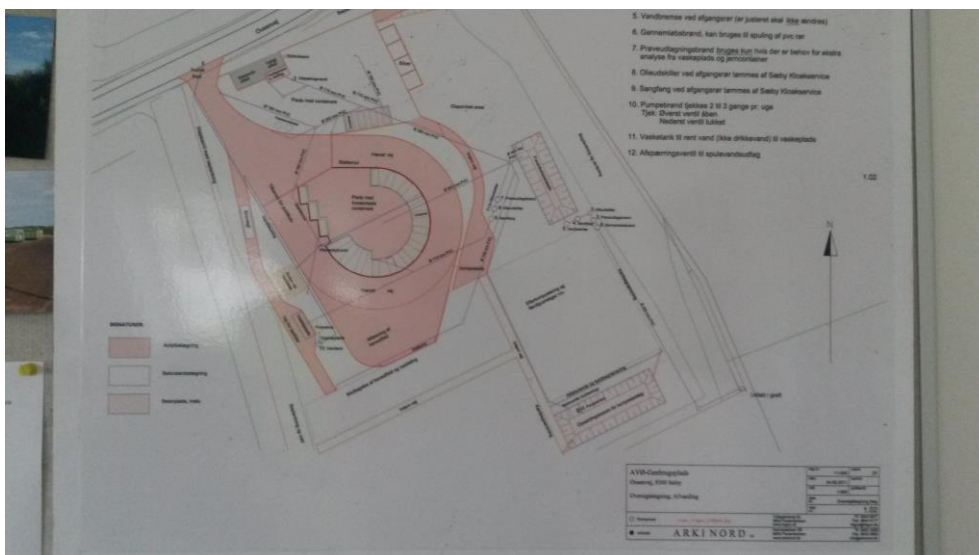
Oversigtsplan med afløb