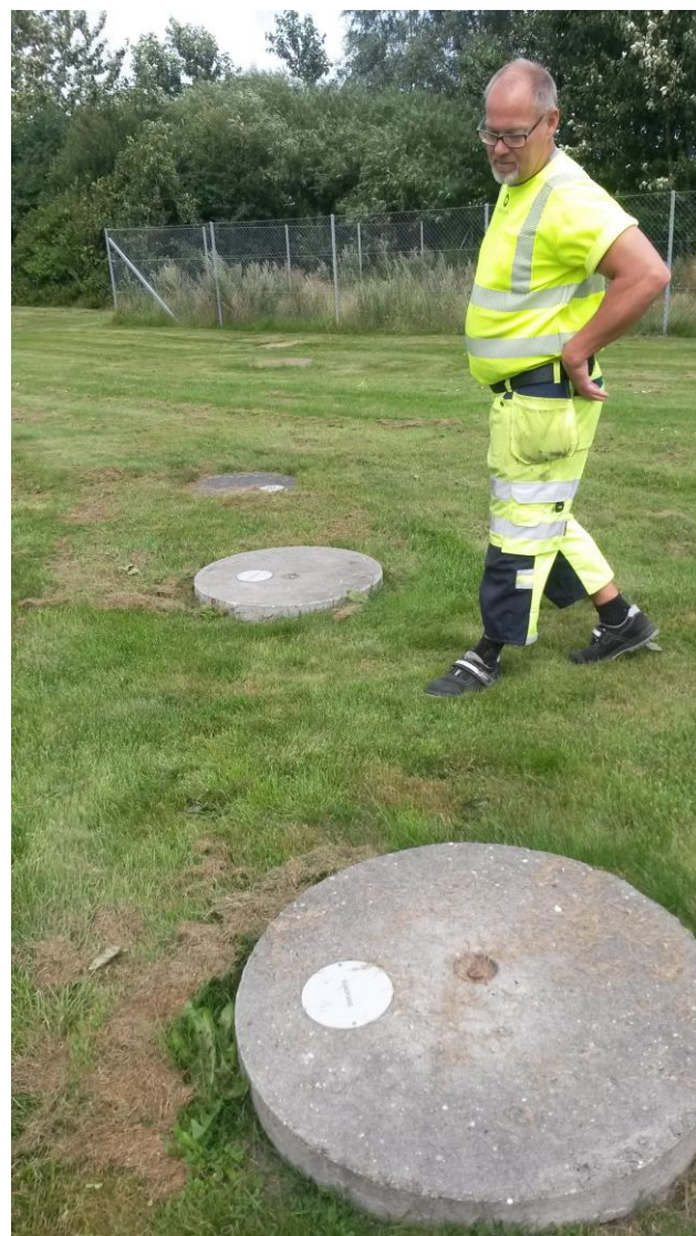
Sandfang og olieudskiller på afløb fra vaskeplads samt jern og metalcontainer.