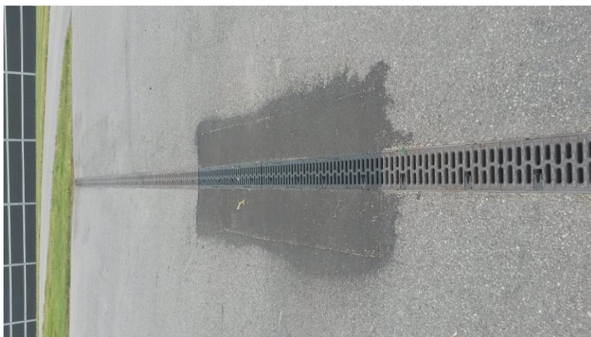
Afløb ved indkørsel til genbrugsområdet udbedret - eks. på hændelse til driftsjournalen.