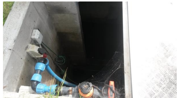
Nødpumpeanlæg for vand fra opsamlingsbassin til recipient via genbrugspladsens forsinkelsesbassin