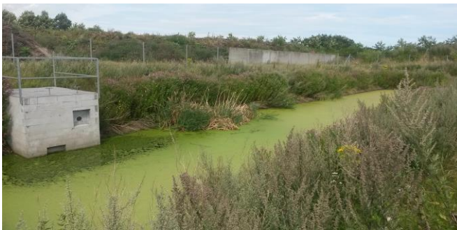
Opsamlingsbassin for overfladevand og perkulat fra komposteringsområde