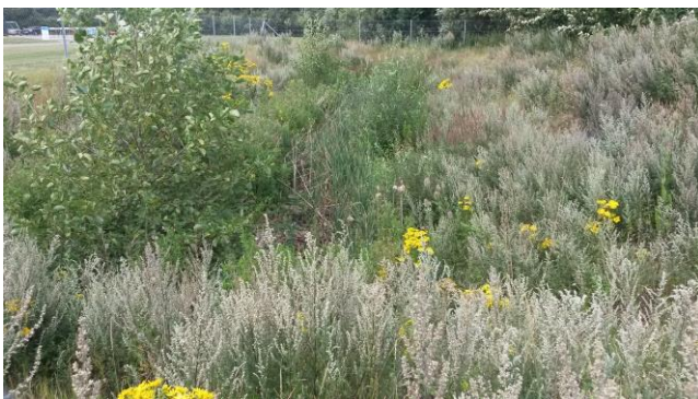
Forsinkelsesbassin fra genbrugspladsen (tilgroet)