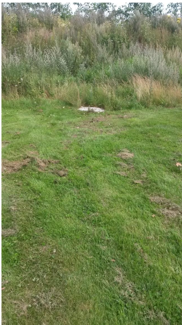
Prøveudtagningsbrønd, sandfang og olieudskiller på afløb fra forsinkelsesbassin