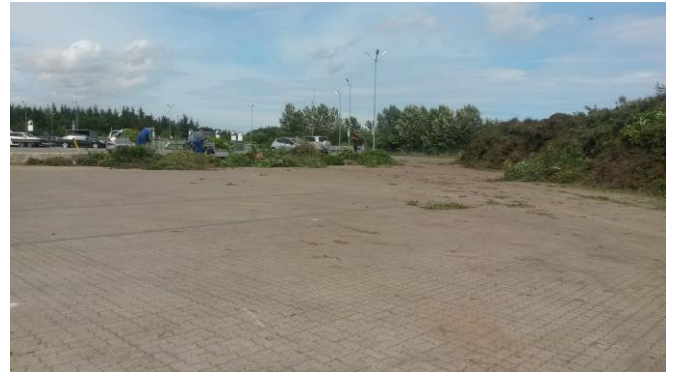
Aflæsning af haveaffald