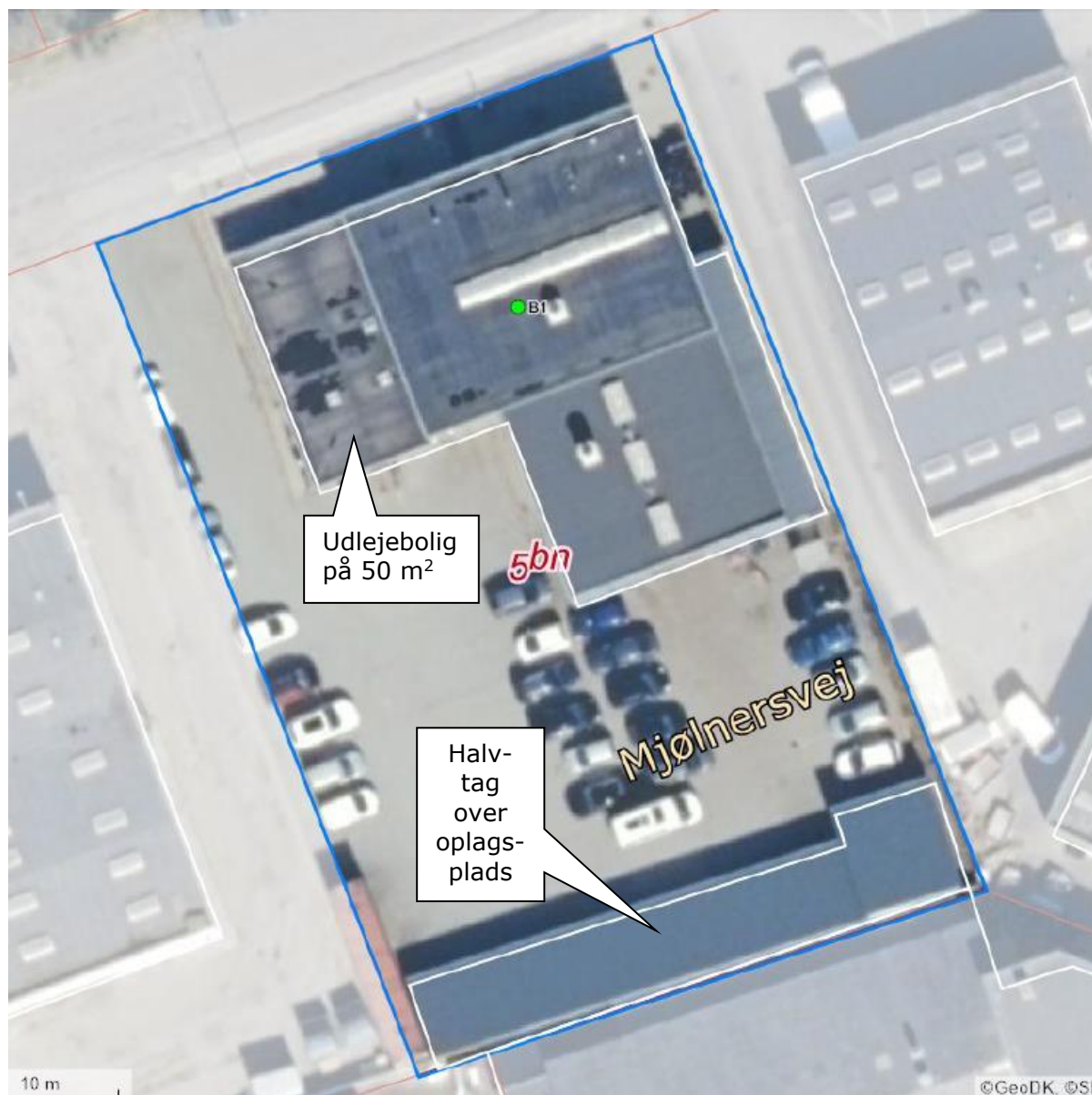
Luftfoto af virksomheden med matrikelskel fra BBR

I forhold til kommuneplanen ligger virksomheden i erhvervsområde 160403ER.