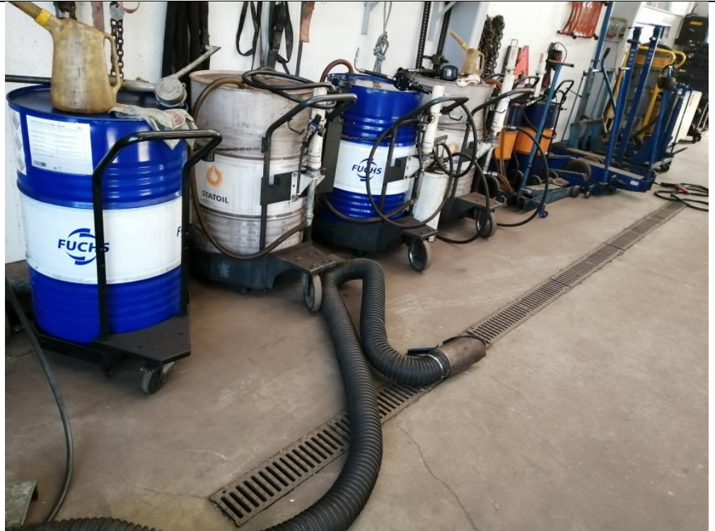
Olie i værksted, 2022

Der opbevares diverse produkter og kemikalier i et lille rum med afløb. Det er aftalt ved tilsynet, at afløbet sløjfes.