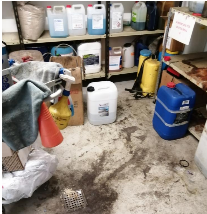
Opbevaring af kemi og produkter, 2022

Der opbevares diverse produkter og kemikalier i et lille rum med afløb. Det er aftalt ved tilsynet, at afløbet sløjfes.