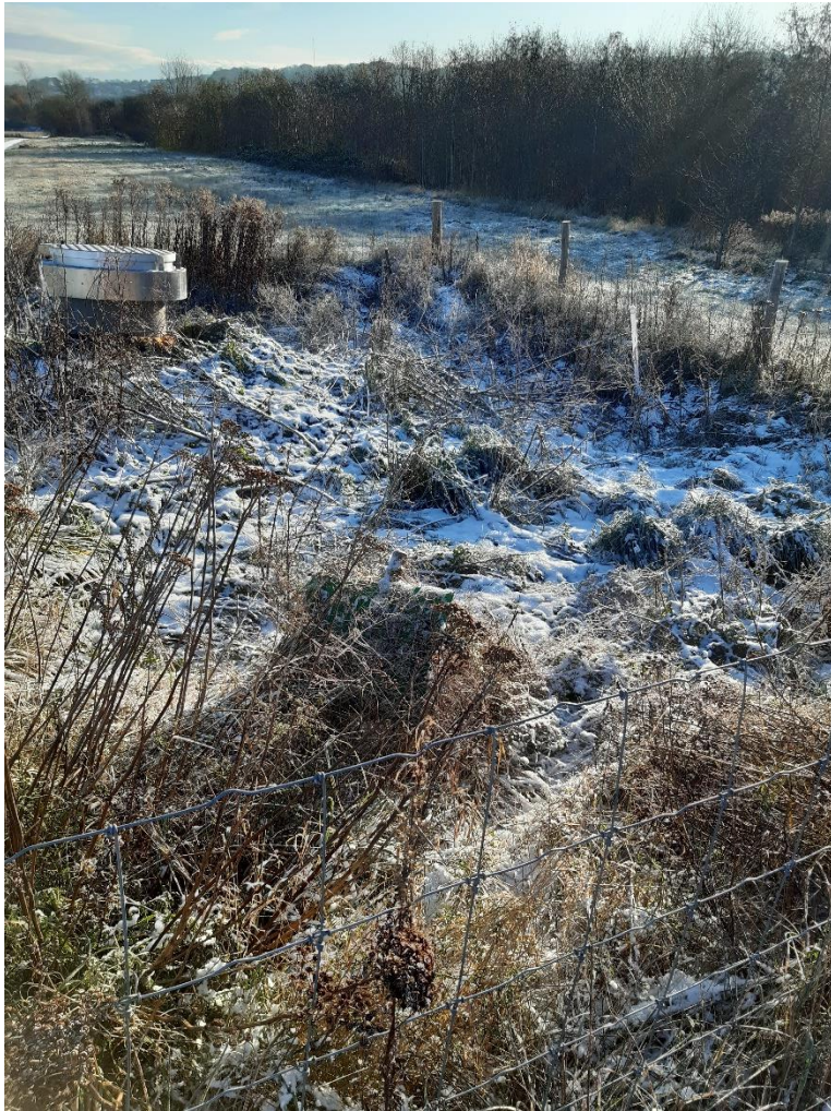
Hegn omkring biocover og perkolatbrønd. På heget hanger der også et oplysningsskilt om ikke at betrede biocoveret. Det ses at biocoveret er sunket en anelse.