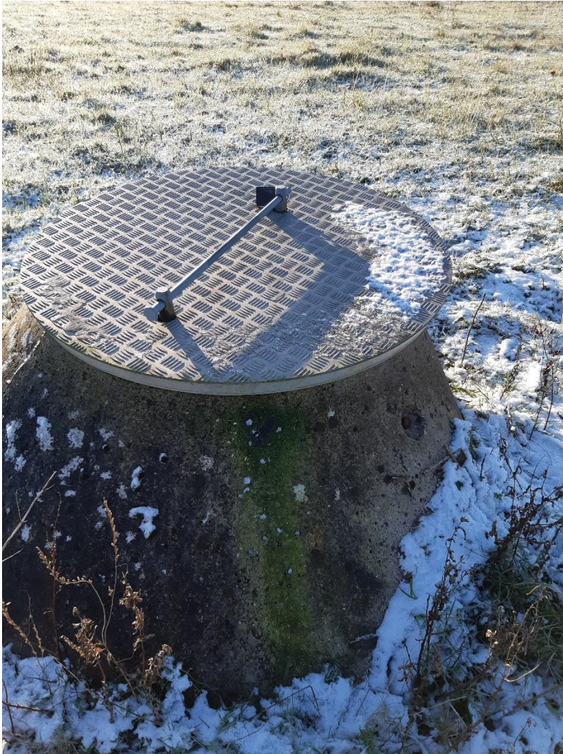
Perkolatbrønd på etape 2. Aflåst og opmærket.