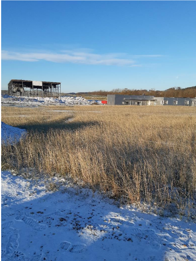
Blik mod den gamle sorteringshal og administrationsbygning.