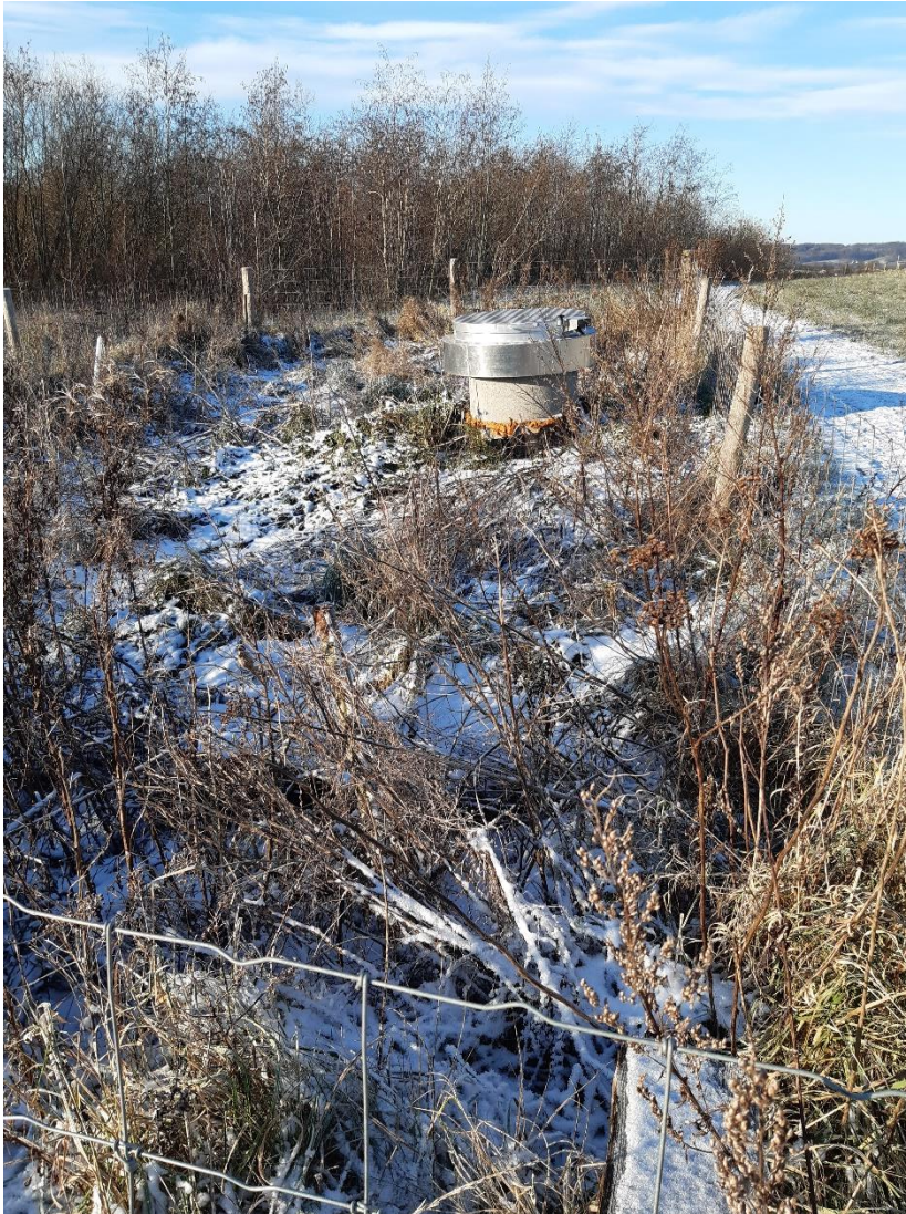
Indhegnet biocover og perkolatbrønd. Det ses at biocoveret er sunket en smule i forhold til terræn.