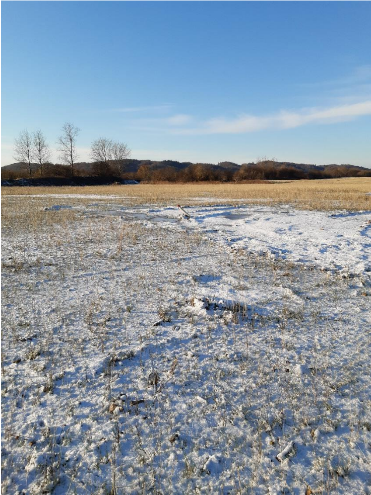
Blik mod sydvest over etape 3, der er nedlukket og slutafdækket.