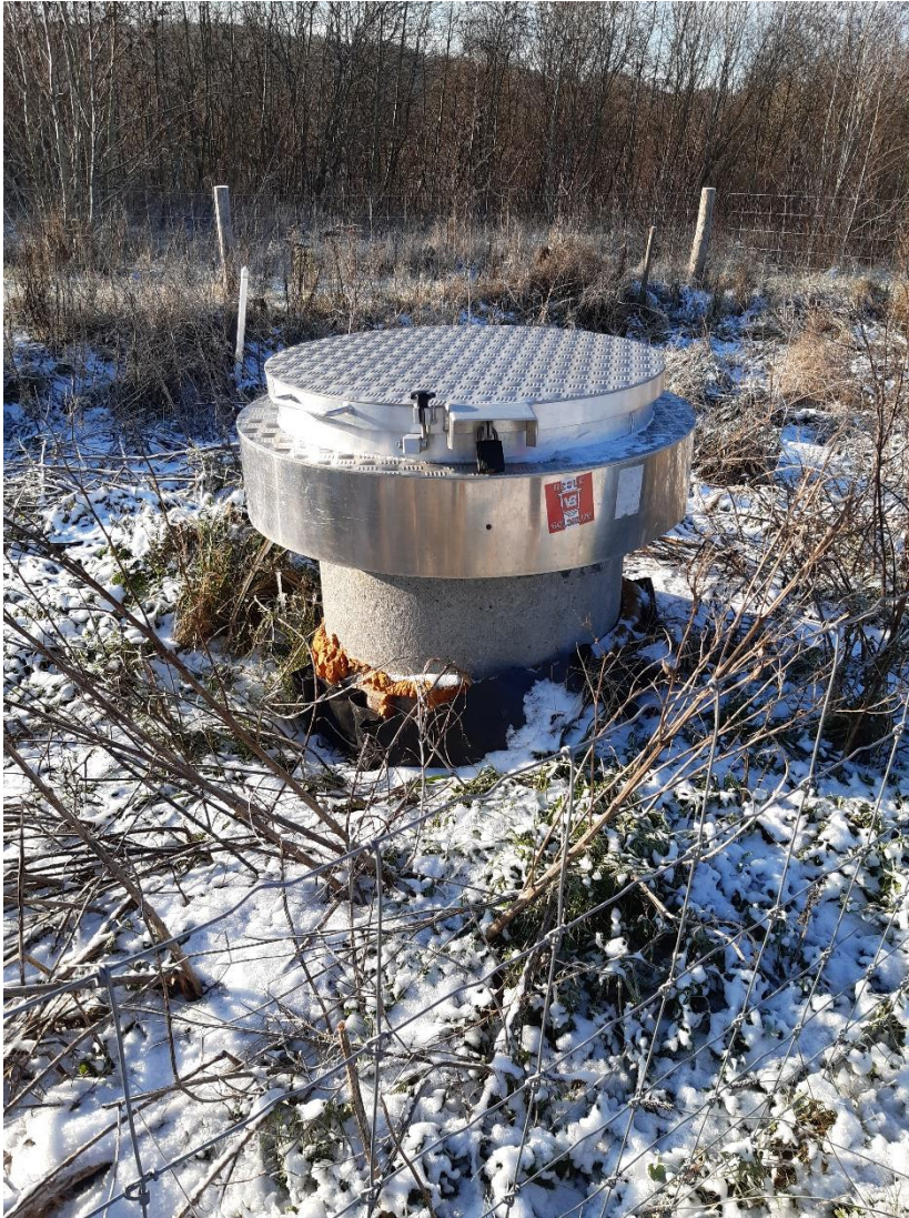
Perkolatbrønd – aflåst og korrekt opmærket.