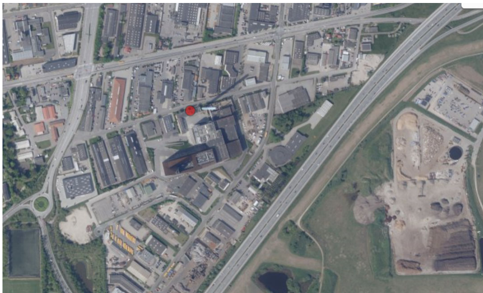
Håndværkervej 70, 4000 Roskilde