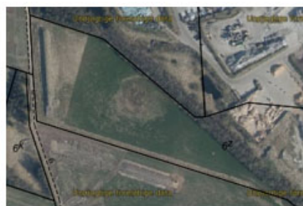
3. Ortofoto 2021 – status for etablering.