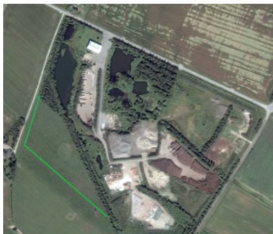
1. Oversigtskort i godkendelsesansøgning fra 2017.