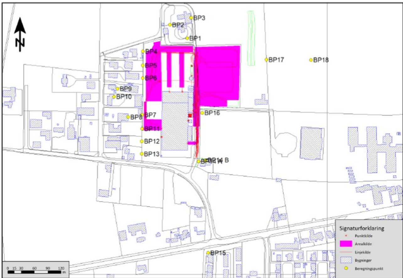
Figur 3. Placering af beregningspunkter.

De punkter, hvor støjen er beregnet, fremgår af figur 4.