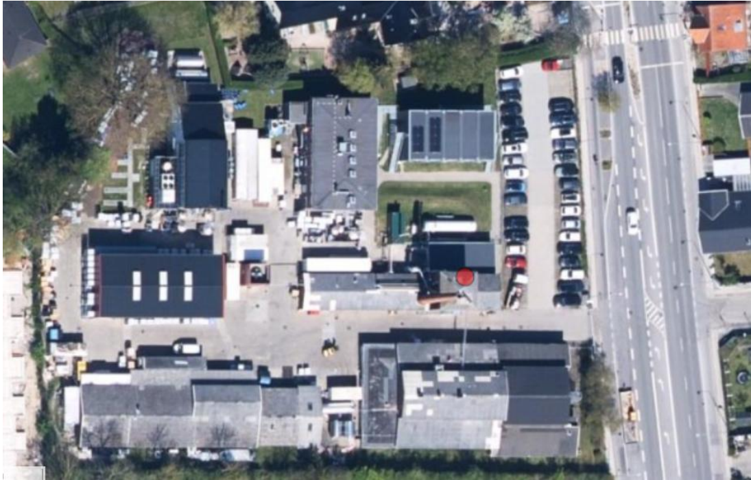
Foto af Orthana beliggende Engelsvej 350-356, 3700 Kastrup