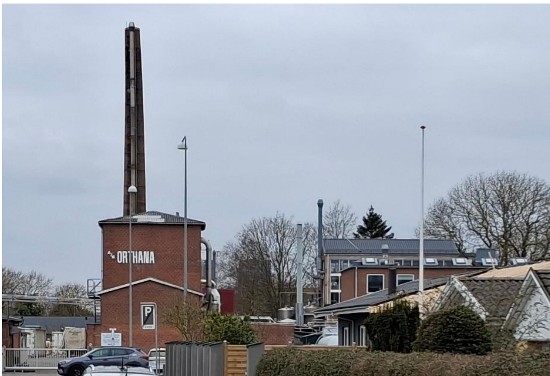
Afkastet der er ført op langs skorstenen er afkastet fra scrubberen, efter spraytørre.