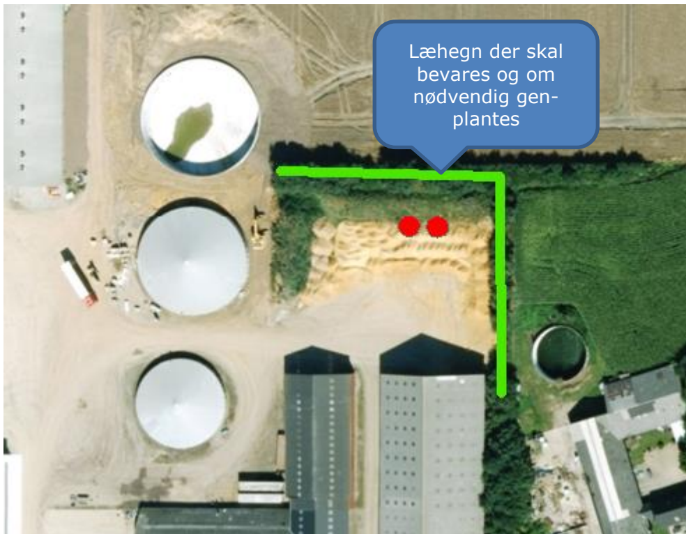
Kort 3: Oversigt over krav til bevarelse af beplantning.

på 32 m til nærmeste bygning derfor ligger i tilknytning til den eksisterende bygningsmasse.