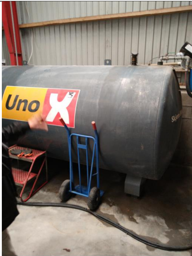
Billede 3: Spild ved dieselolietank.