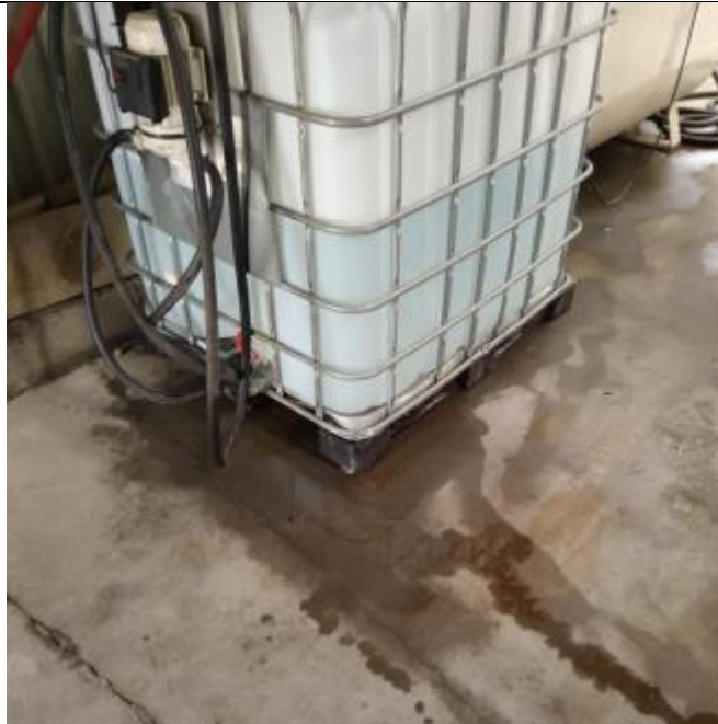
Billede 2: Adblue pallettank med friske spild på belægning.

Kølervæske, motorolie og sprinklervæske stod i en container inde i garageanlægget således, at det ikke kunne løbe ud og forurene jord, grundvand og spildevand.