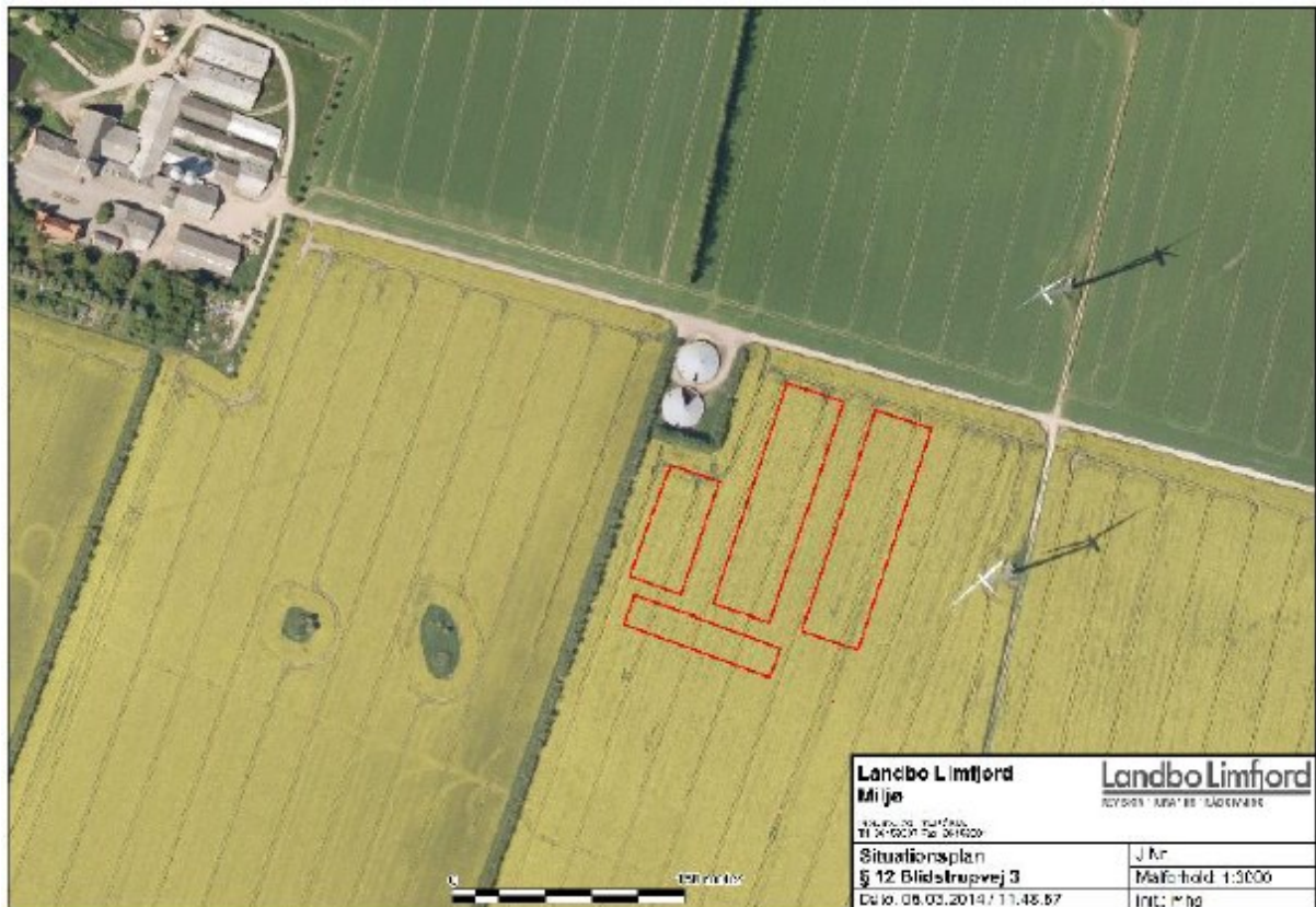
HYLLESTED BYGADE 23, 8400 EBELTOFT MOB: 61666535