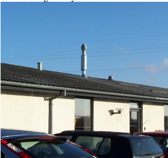
Afkast fra loddestation ca. 1-2 m over tag

Endvidere findes afkast fra naturgasfyr (2 stk.), hhv. i BG 1 og BG 3.