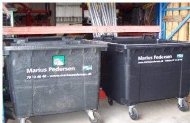
Containere til hhv. papir og pap samt brændbart affald