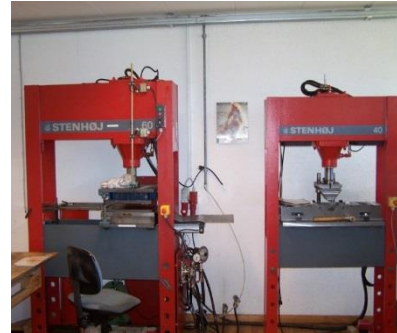
To hydrauliske pressere for hhv. skjold og låg