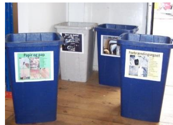
Indendørs containere til jern, aluminium og papir/pap etc.