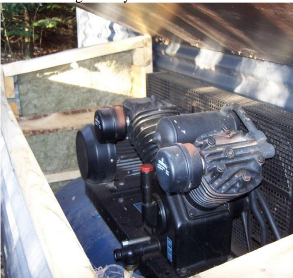
Stempelkompressor, placeret i buldrekasse syd for bygning 3