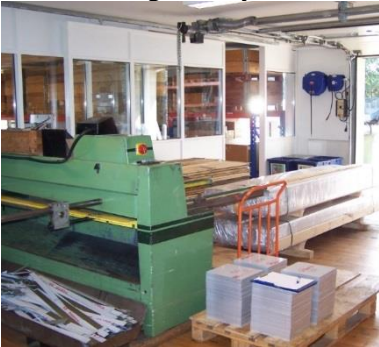
Lange profiler til opskæring – til højre