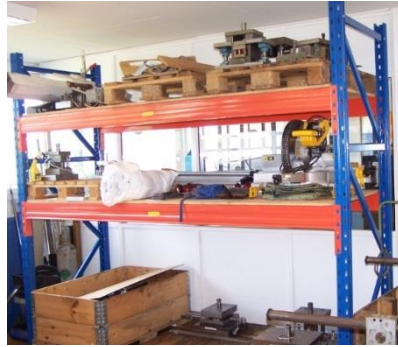
Opskæring med gearings-sav