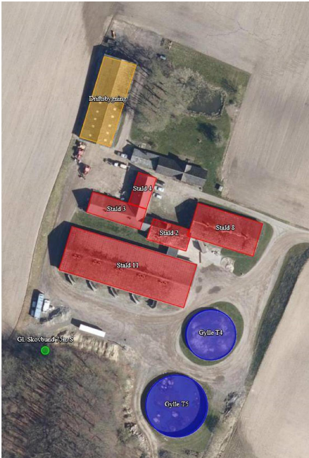
Figur 2-1 Oversigt over produktionsanlægget