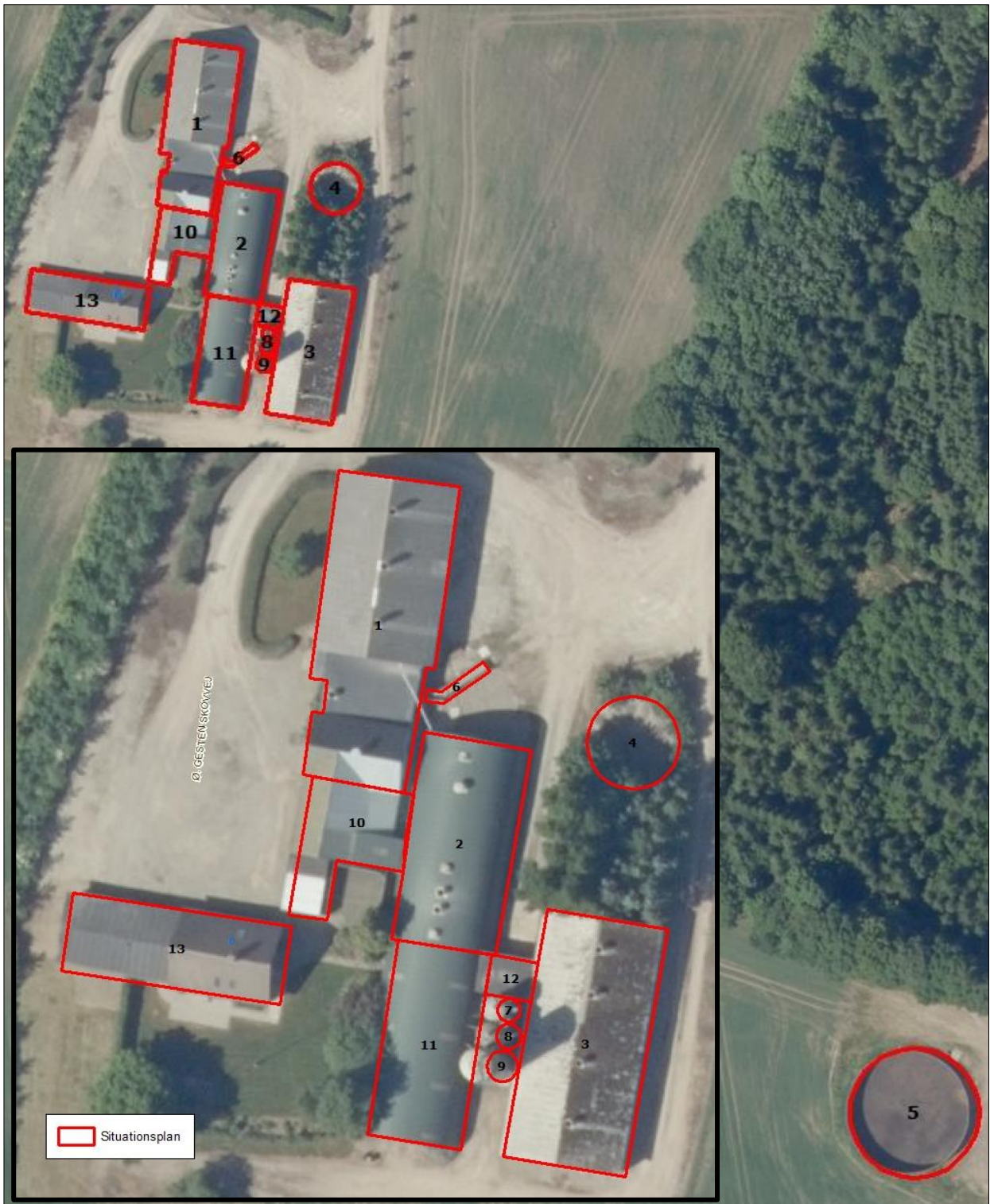
Figur 1. Husdyrbrugets driftsbygninger.