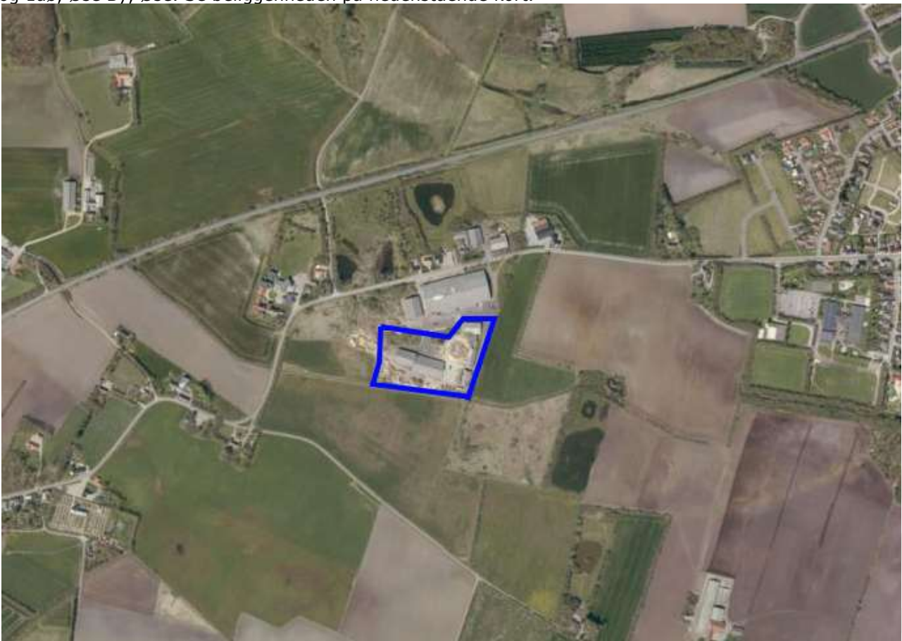
Figur 1: Knusepladsens beliggenhed i det åbne land.

Virksomheden er beliggende i det åbne land på Sønderskovvej 113, 6800 Varde, matrikelnummer 1aæ og 1aø, Øse By, Øse. Se beliggenheden på nedenstående kort.