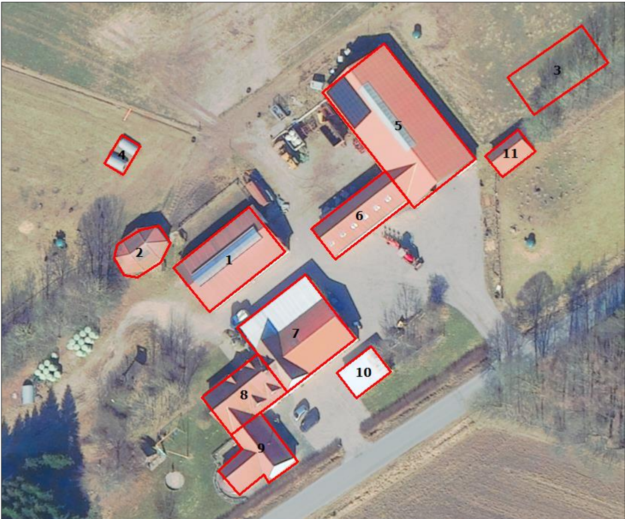
Figur 1. Husdyrbrugets driftsbygninger.

De flytbare læskure (rundbuehallerne) er placeret på egne arealer (og vekslende tillejede arealer), hvor de flyttes rundt - se figur 2 herunder.