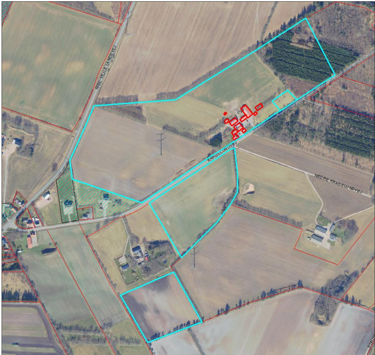
Figur 2. Husdyrbrugets ejede arealer (markeret med blå streg).