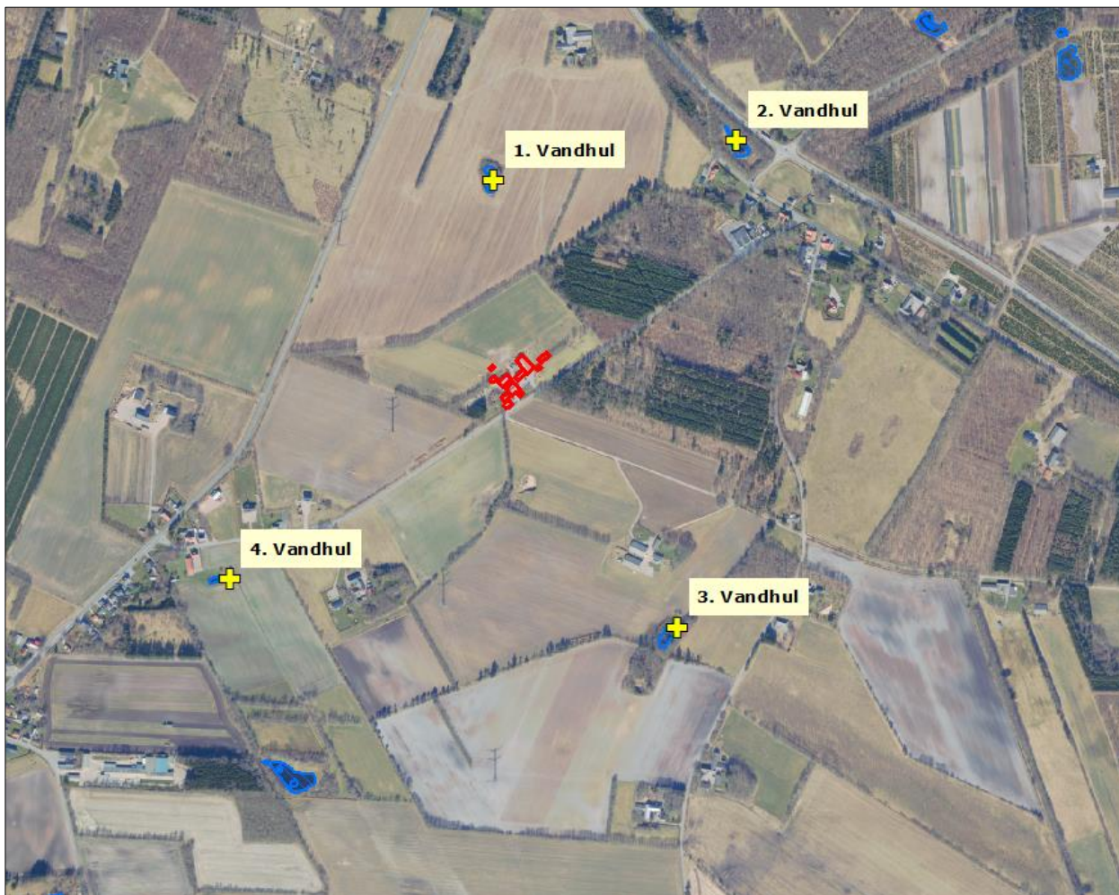
Figur 5. Kort over kategori 3 samt § 3 natur ved anlægget.

Der sker således ikke nogen væsentlig påvirkning af naturtyperne, og Vejen Kommune vurderer, at der ikke er behov for at stille skærpede vilkår for at begrænse ammoniakdepositionen på naturtyperne.