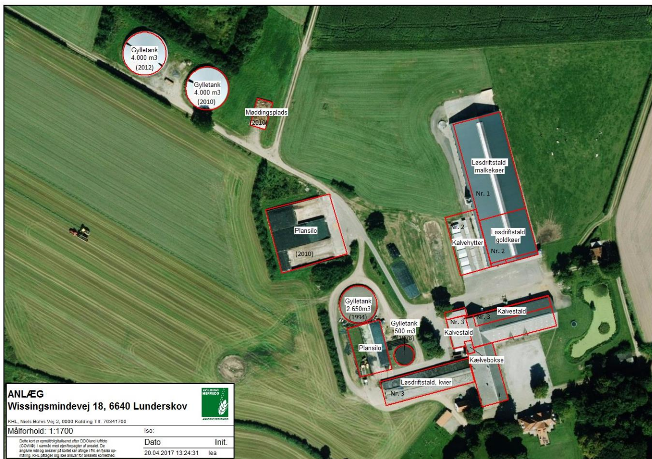
Figur 1. Oversigt over staldanlæggene på Wissingsminde.

Staldanlæggene fortsætter uændret ligesom malkekvægproduktionen (jf. figur 1 og tabel 1).