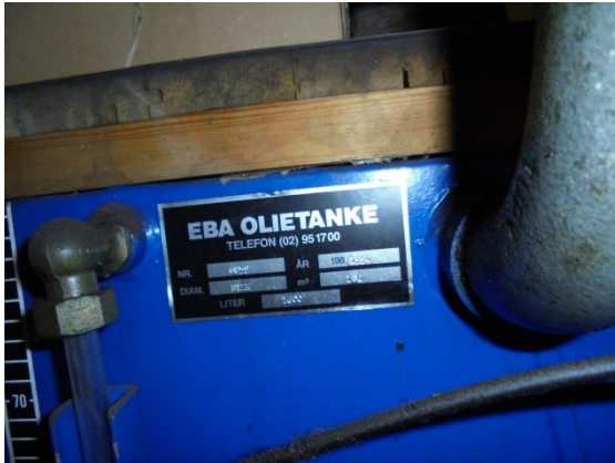
Bulktank i værkstedet. 1.600 liter fra 1990

Det blev aftalt, at virksomheden afmelder den afproppede nedgravede tank og anmelder bulktanken til ny motorolie til kommunens BBR-register.