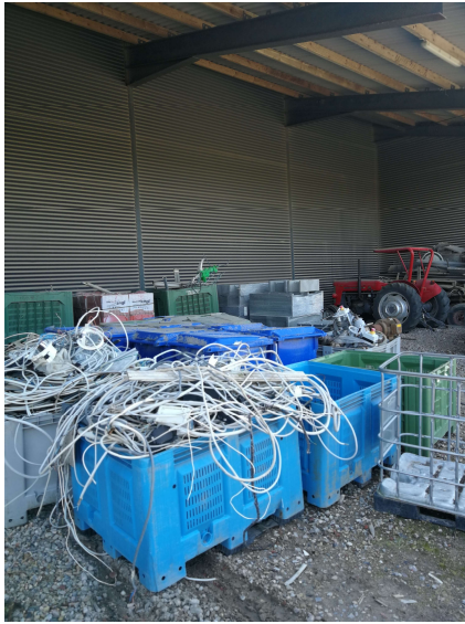
Beholdere med affaldskabler