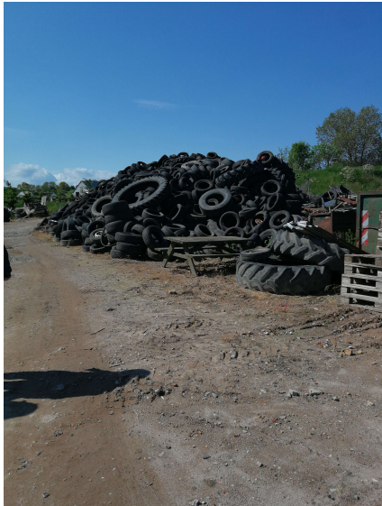
Oplag af dæk

Der er ca. 30 tons dæk på oplagret på virksomheden. Dette er ikke indeholdt i miljøgodkendelsen. Der skal laves et tillæg til den eksisterende miljøgodkendelse. Virksomheden vil få besked når sagen tages op.