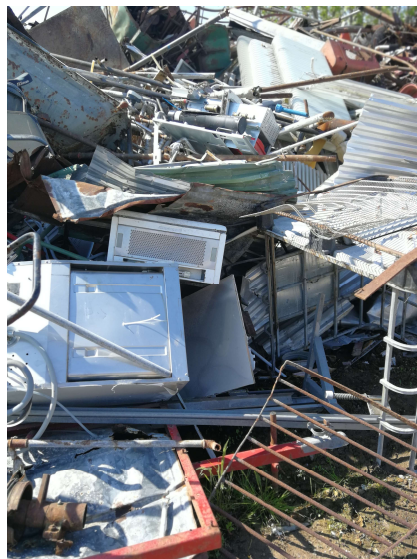
Oplag af metalaffald iblandet elektronikaffald

Elektronikaffald indeholder tungmetaller og skal frasorteres metalskrot og opbevares på tæt belægning og under tag, så det ikke kan regne på det. Virksomheden har oplyst, at alt metalaffaldet er fjernet om 3 måneder og at elektronikaffald fremover frasortes.