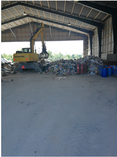
Omlastning i hal