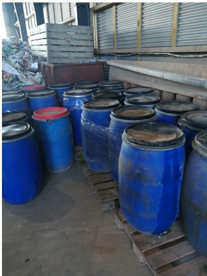
Paller med brugt fritureolie

Beholdere til brugt fritureolie står i hallen på tæt belægning. Leveres til B. I. Miljø i Ørbæk. Dæk bliver opbevaret udendørs og aftages af Genan.