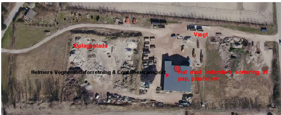
Kortudsnit over Helmers Vognmandsforretning

Bekendtgørelse nr. 1257 af 27. november 2019 om indretning, etablering og drift af olietanke, rørsystemer og pipelines (Olietankbekendtgørelsen).