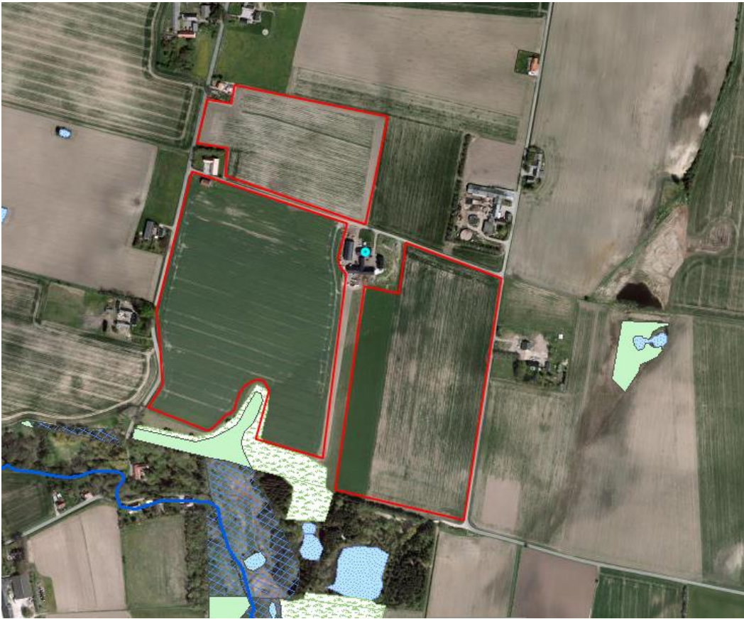
Udbringningsarealer og § 3 natur