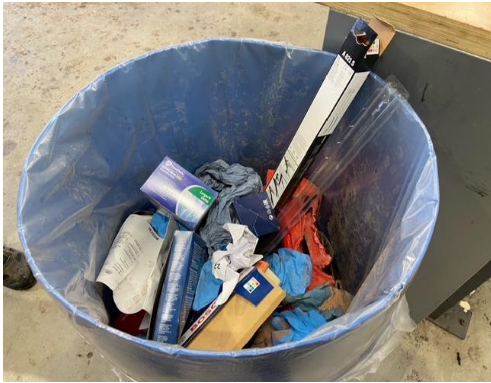
Figur 3 Skraldespand på værksted med Blandet affald bl.a papir, pap og olieholdige klude