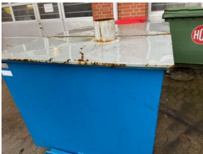
Figur2:lille container med hul i låg