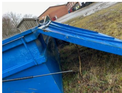
Figur 1: Stor container hvorfra der bliver afhentet metalskrot, Stod med åbent låg