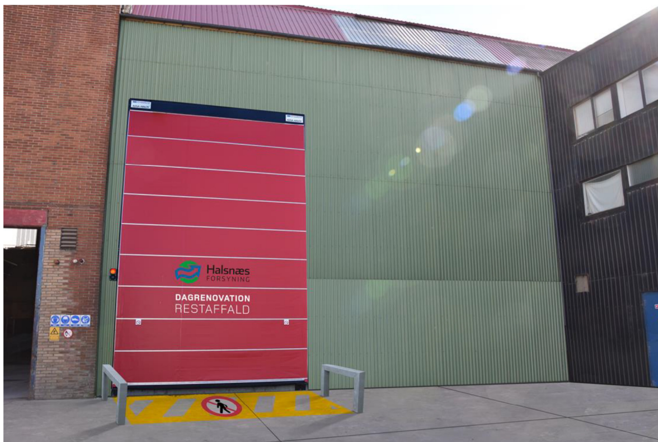
Figur 2 - Port til hal.