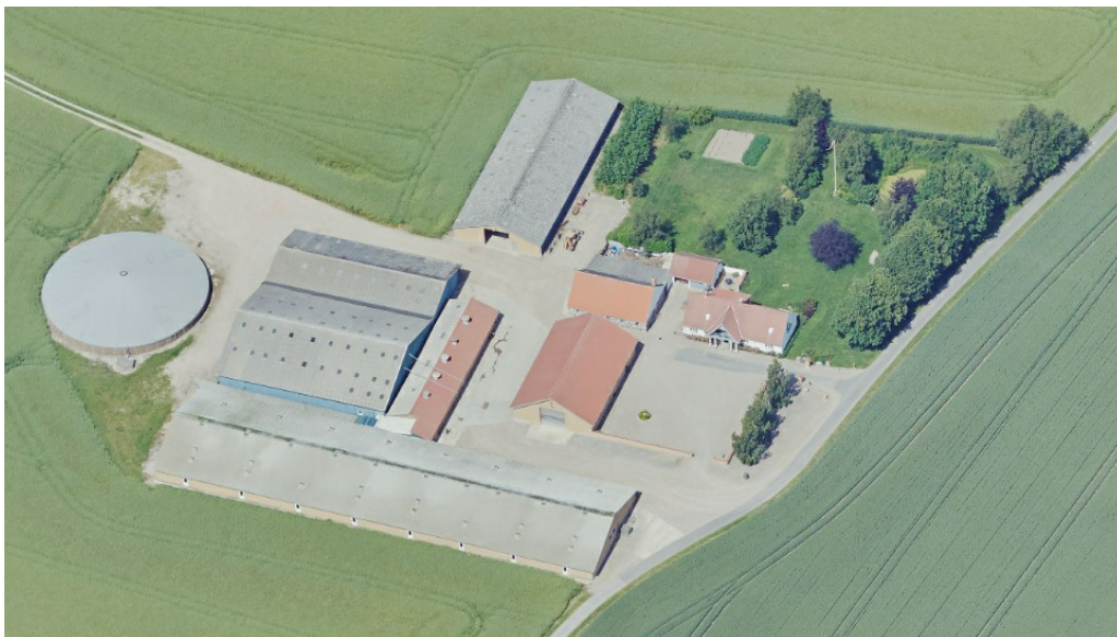
Husdyrbruget på Spanggårdsvej 2.

Husdyrbruget på Spanggårdsvej 2, 5853 Ørbæk blev miljøgodkendt af Nyborg Kommune i august 2012 efter § 12, stk 2 i den daværende miljøgodkendelseslov 1 til en årlig produktion på 10.000 slagtesvin (32-108 kg) og 7 ammekøer med 7 årsopdræt og 4 tyrekalve. Ansøgningen blev indsendt gennem www.husdyrgodkendelse.dk med skema nr 22813. Husdyrbruget var en IPPC virksomhed, hvilket med nutidens betegnelser hedder et IE husdyrbrug. Et svinebrug er omfattet af EU's direktiv for industrielle emissioner (IE), hvis det har mere end 2.000 stipladser til slagtesvin.