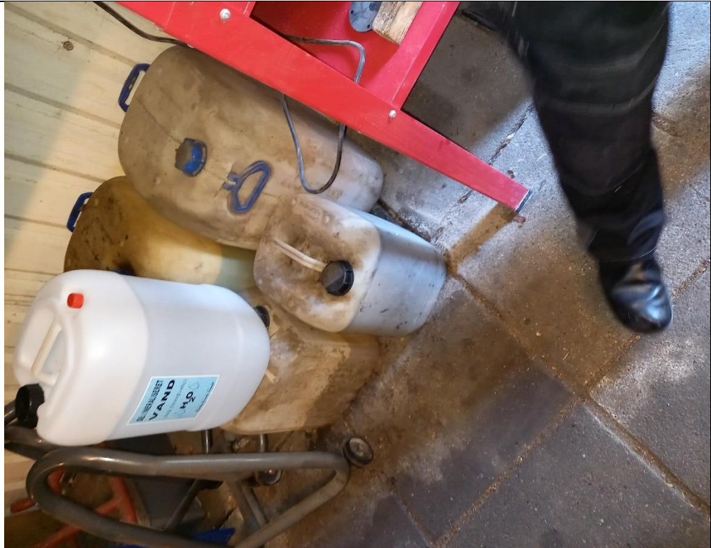
Billede 3. kølervæske m.m. placeret på flisebelagt gulv.

Motorcykelværkstedets øvrige farligt affald er placeret på en spildbakke.