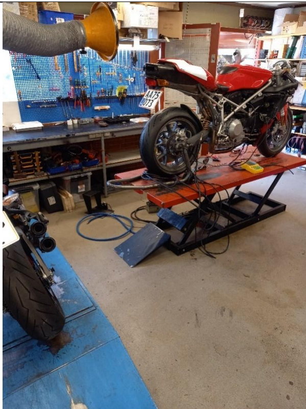
Billede 2. værkstedet med lift og udsugning.

Som man kan se på billede 2, er belægningen tæt. Der er intet afløb i værkstedet.