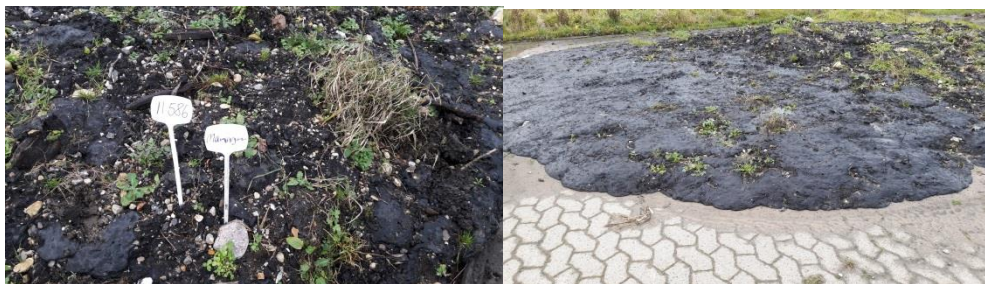
Figur 1 og 2: Modtaget parti tjæreholdigt jord fra Mariager Fjord Kommune hidrørende fra veteranbaneområde.

Det kunne ved tilsynet konstateres, at der var modtaget et parti forurenede jord, der indeholder forurening i fri fase (tjære), jf. figur 1 og 2, ID SO11586 (jordveb 12407, vejeseffel). Dette er i strid med vilkår B12 1 , men da der er tale om tjære vurderes risikoen for afstrømning af fri fase fra milerne minimal, forudsat jordpartiet fjernes inden foråret 2018. RGS anmodes om at fremsende dokumentation i form af kopi af anmeldelse iht. jordflytningsbekendtgørelsen senest 1. marts 2018 for, at jordpartiet er fraført anlægget i Rærup.