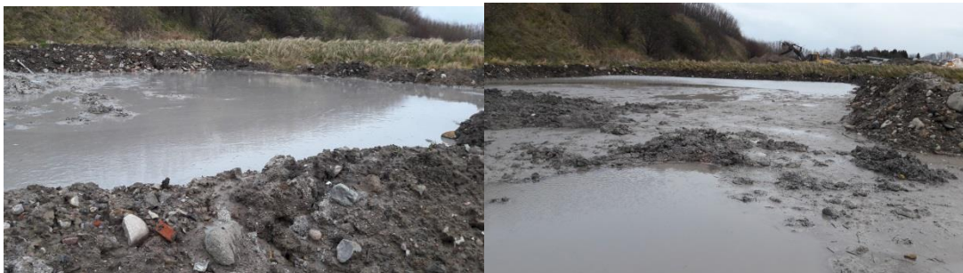
Figur 5 og 6: Der var modtaget to partier af boremudder fra projekter ved dybdeboringer

Der var opstået lunker med stillestående overfladevand i befæstigelsen som følge af tung arbejdskørsel. Det er aftalt, at disse udbedres i sommerhalvåret 2018. Indtil lunkerne er udbedret, må der ikke oplagres jord på arealerne, hvor lunkerne er opstået.