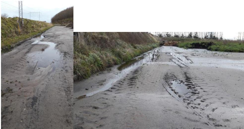
Figur 3 og 4: Lunker i SF stenbelægningen, midt for vold på henholdsvis syd- og nordside af pladsen.

Der var opstået lunker med stillestående overfladevand i befæstigelsen som følge af tung arbejdskørsel. Det er aftalt, at disse udbedres i sommerhalvåret 2018. Indtil lunkerne er udbedret, må der ikke oplagres jord på arealerne, hvor lunkerne er opstået.