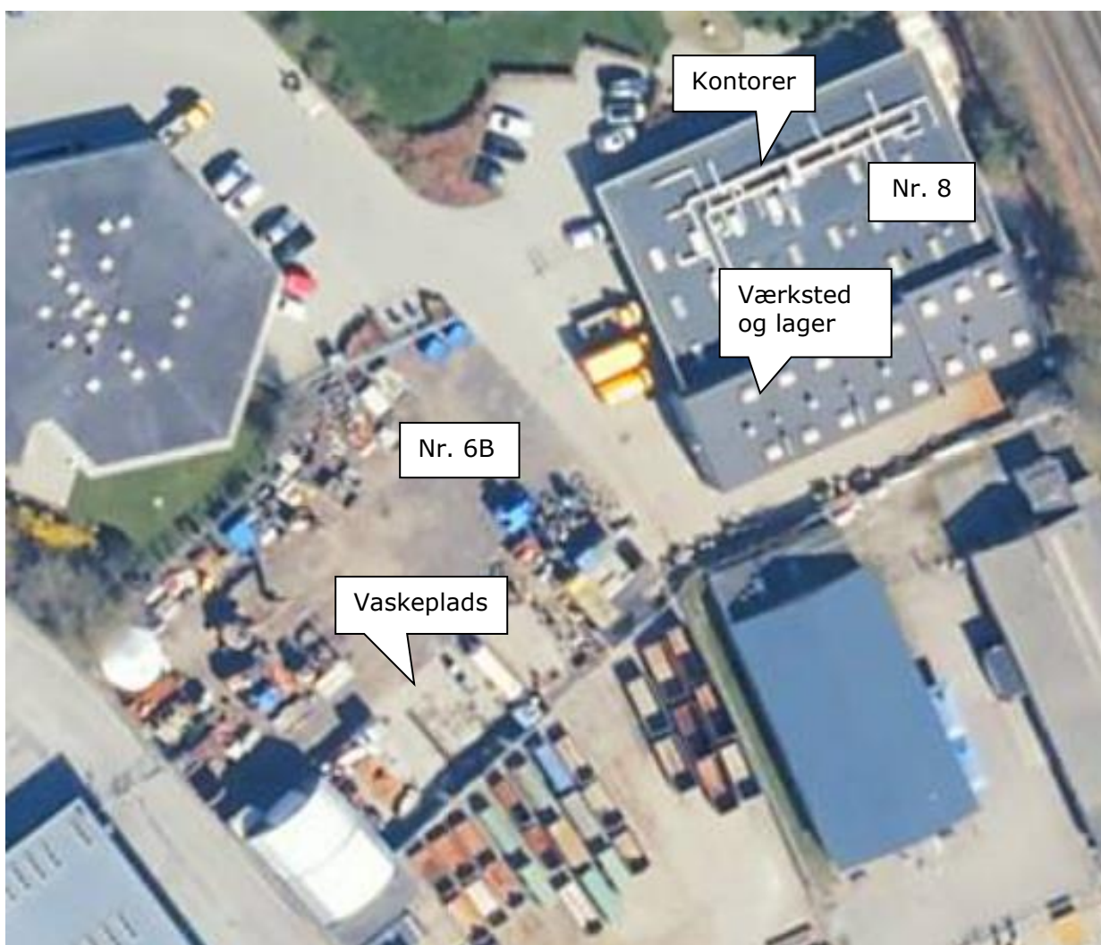
Luftfoto af Viengevej 8 og 6B

I forhold til kommuneplanen ligger Viengevej 8 og 6B i erhvervsområde 150508ER.