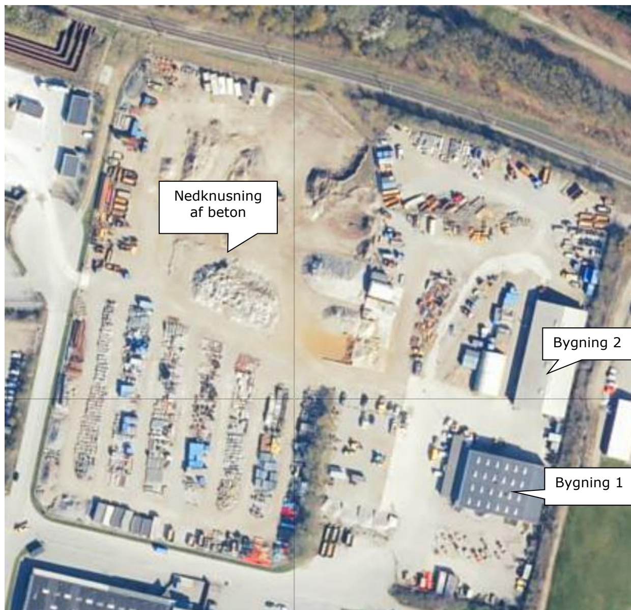
Luftfoto af Norddigesvej 8 - 10

I forhold til kommuneplanen ligger Norddigesvej 8-10 i erhvervsområde 150509ER.