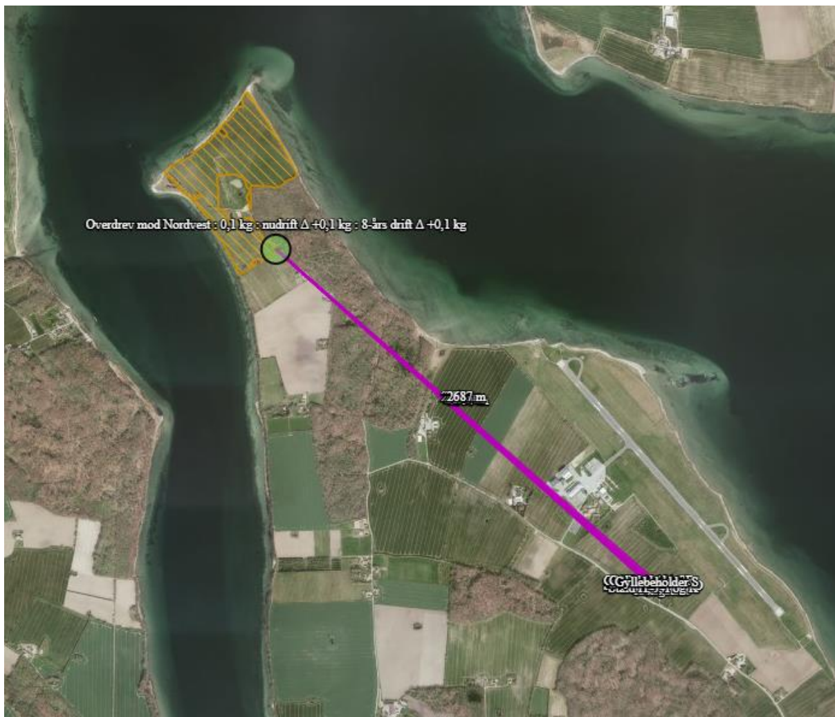
Figur 2: Afstand fra ejendom til Kategori 2 naturområde overdrev nord for anlægget