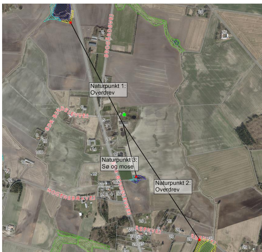
Figur 2: Husdyrbrugets beliggenhed i forhold til naturpunkt 1-3 (rød prik).