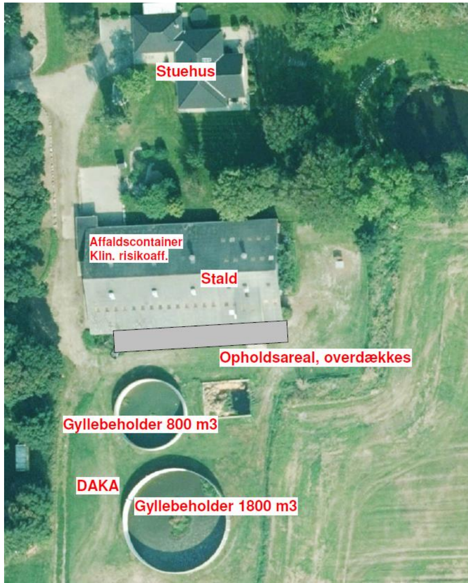
Figur 4: Oversigt over ejendommen