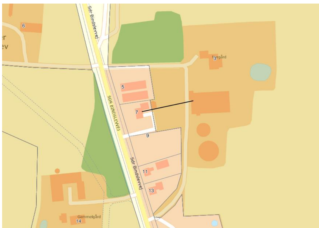
Figur 3: Nærmeste nabo med uden landbrugspligt

Som det ses af Tabel 5 , overholder den ansøgte produktion lovens minimumskrav til lugtgeneafstande til de forskellige typer af beboelser i området.