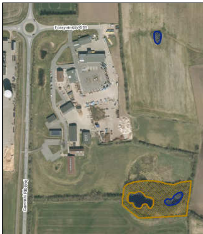
Figur 1: Kort over §3-natur i nærheden af genbrugspladsen. Blå skravering = sø; Brun skravering = mose

Virksomheden er omfattet af VVM-lovens bilag 2 punkt 13a) "Ændringer eller udvidelser af projekter i bilag 1 eller nærværende bilag, som allerede er godkendt, er udført eller er ved at blive udført, når de kan have væsentlige skadelige indvirkninger på miljøet (ændring eller udvidelse, som ikke er omfattet af bilag 1)." Vurdering og afgørelse om VVM kan ses i bilag 1.