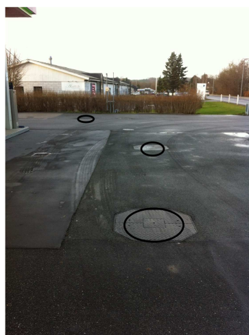
Visende placering af 3 mandehuller

Påfyldningsplads og salgsplads har fald mod afløb, som er koblet på olieudskiller. Salgsplads er overdækket.