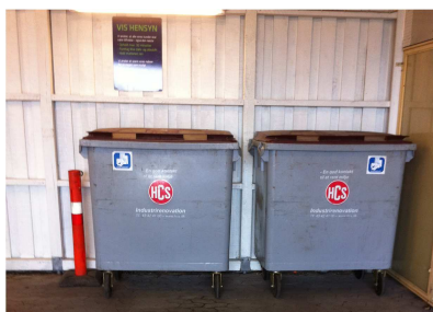
2 containere fra HCS

Der er opstillet 2 containere til brændbart affald, som afhentes af HCS Industrirenovation en gang om ugen.