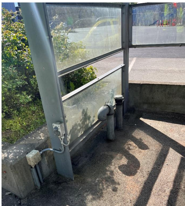
Påfyldningsstuds til olietank