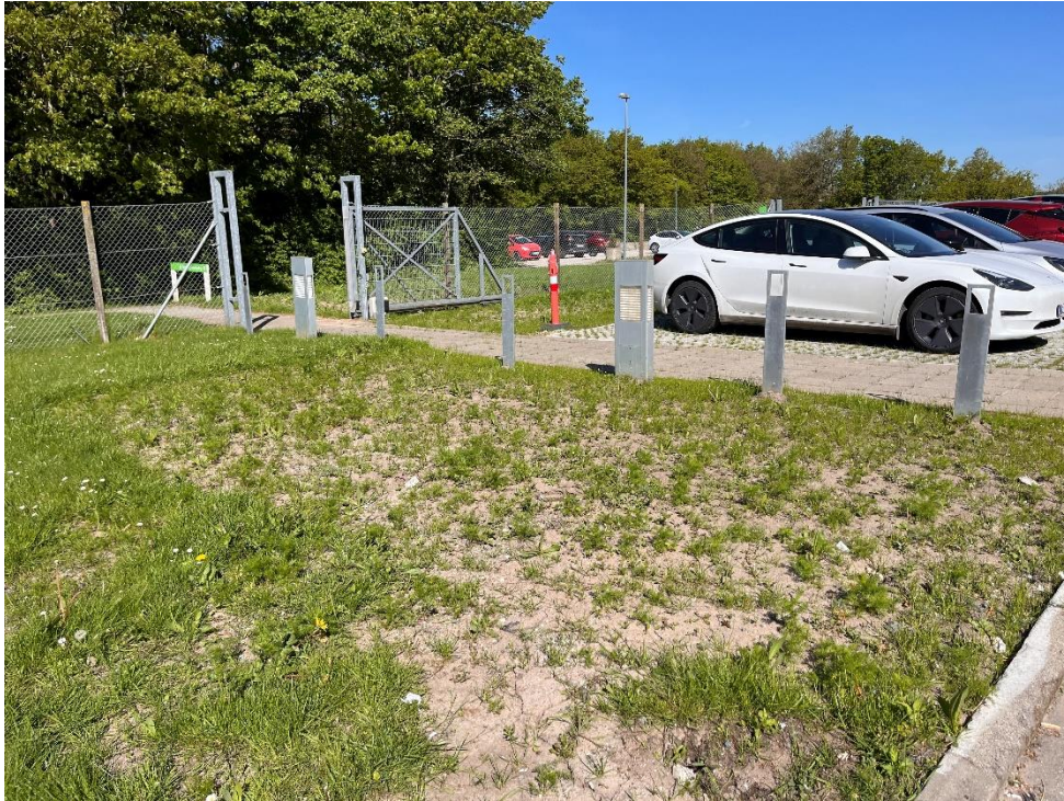
Areal hvor oprensning er foretaget