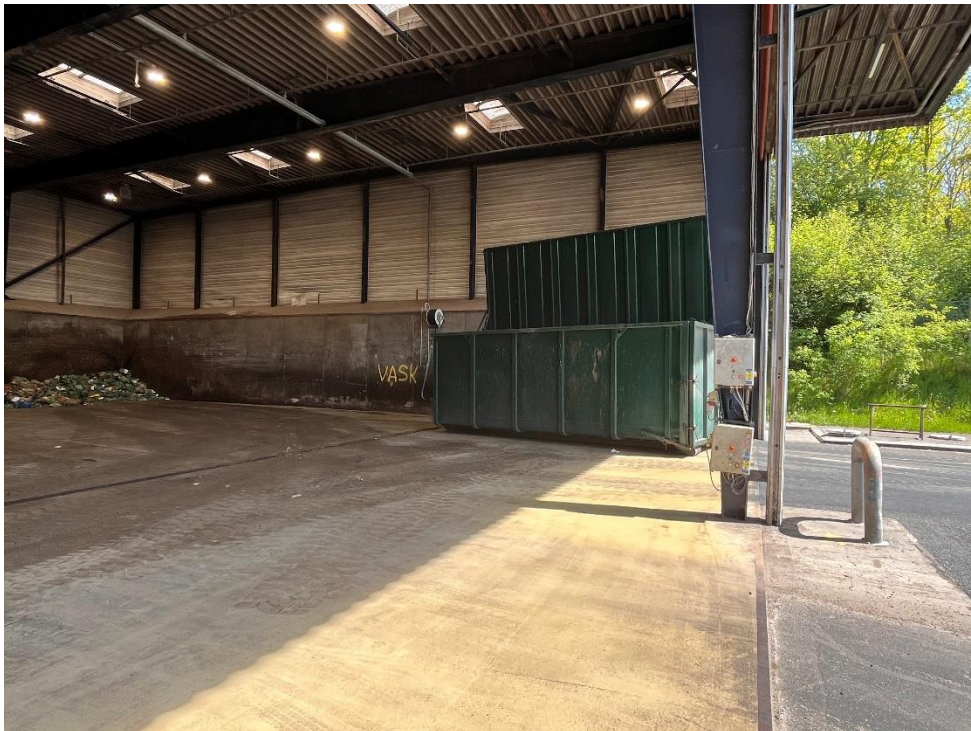
Dæksel til perkolattank ses i baggrunden af billedet. Perkolat afhentes med slamsuger