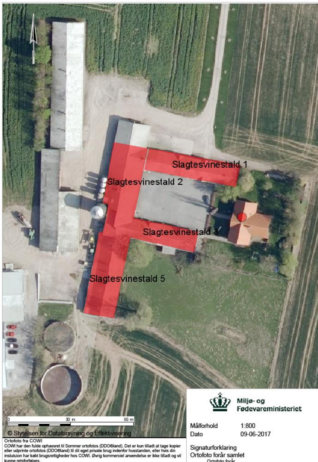
Billede fra ansøgningsmaterialet