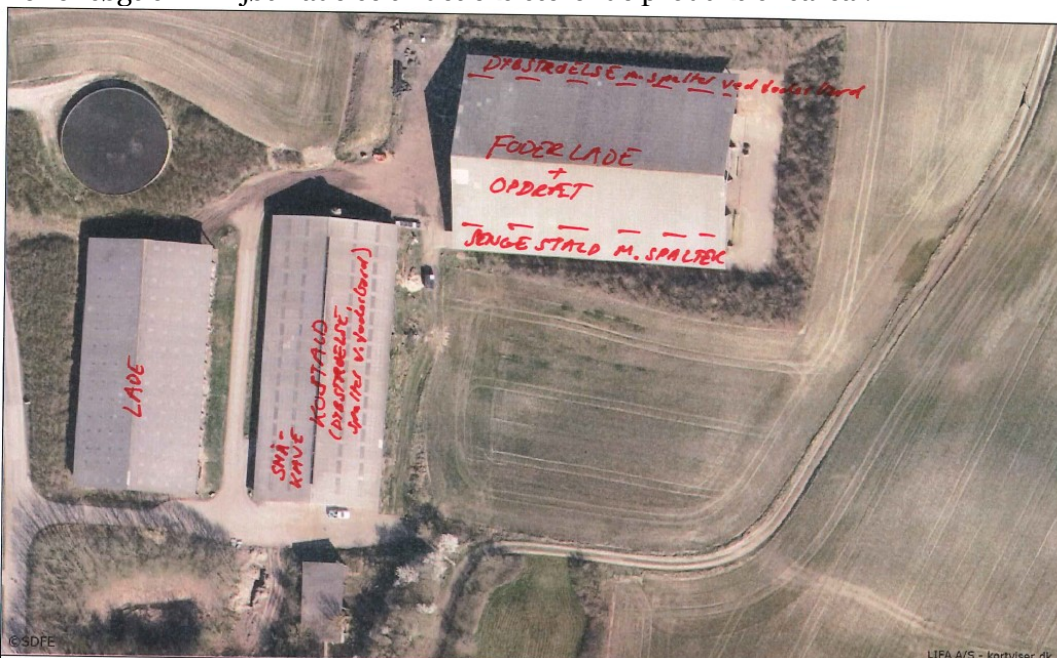
Figur 1: Skitse over produktionsareal og dyrenes placering på Orte Byvej 18, 5560 Aarup.

Der er søgt om miljøtilladelse til det eksisterende produktionsareal.