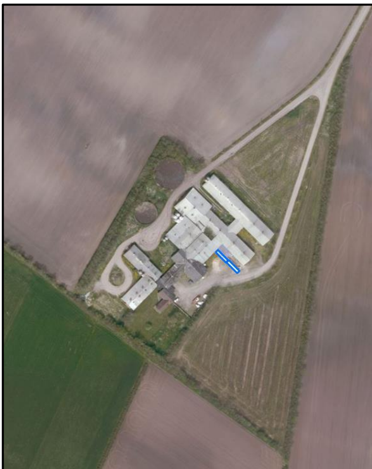
Figur 2. Ændringen af husdyrbruget med opstilling af to klimacontainere markeret med blå. Husdyrbruget er afskærmet med beplantning.

Dyreholdets sammensætning og størrelse ændres ikke. Gyllesystemet ændres ikke. Varde Kommune har beregnet, at ammoniakdepositionen til det nærmeste naturområde, som er et kategori 2 natur i form af en mose ca. 370 meter nord øst for husdyrbruget, ikke påvirkes yderligere. Varde Kommune beregner en deposition på 0,6 kg N såvel før som efter ændringen.