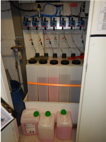
1. Opbevaring af vaskemidler.