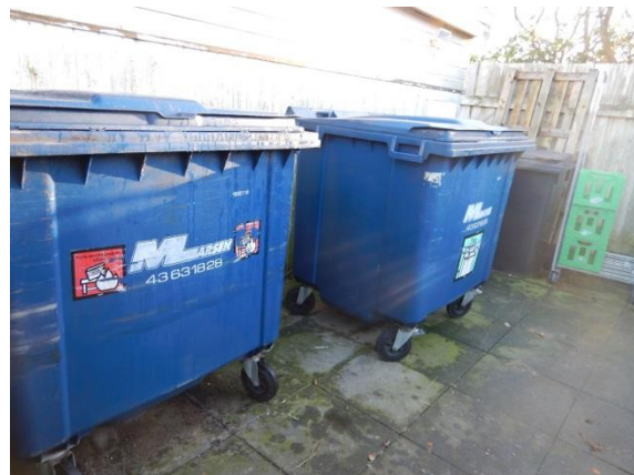
4. Affaldsbeholdere i affaldsgård.