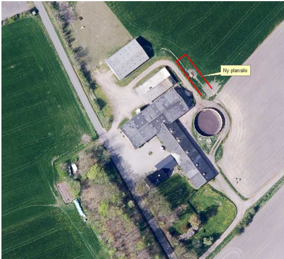
Kort 1: Placering af ensilageplansilo og eksisterende bygninger

Placeringen af det ansøgte i forhold til bedriftens eksisterende bygninger fremgår af kort 1.