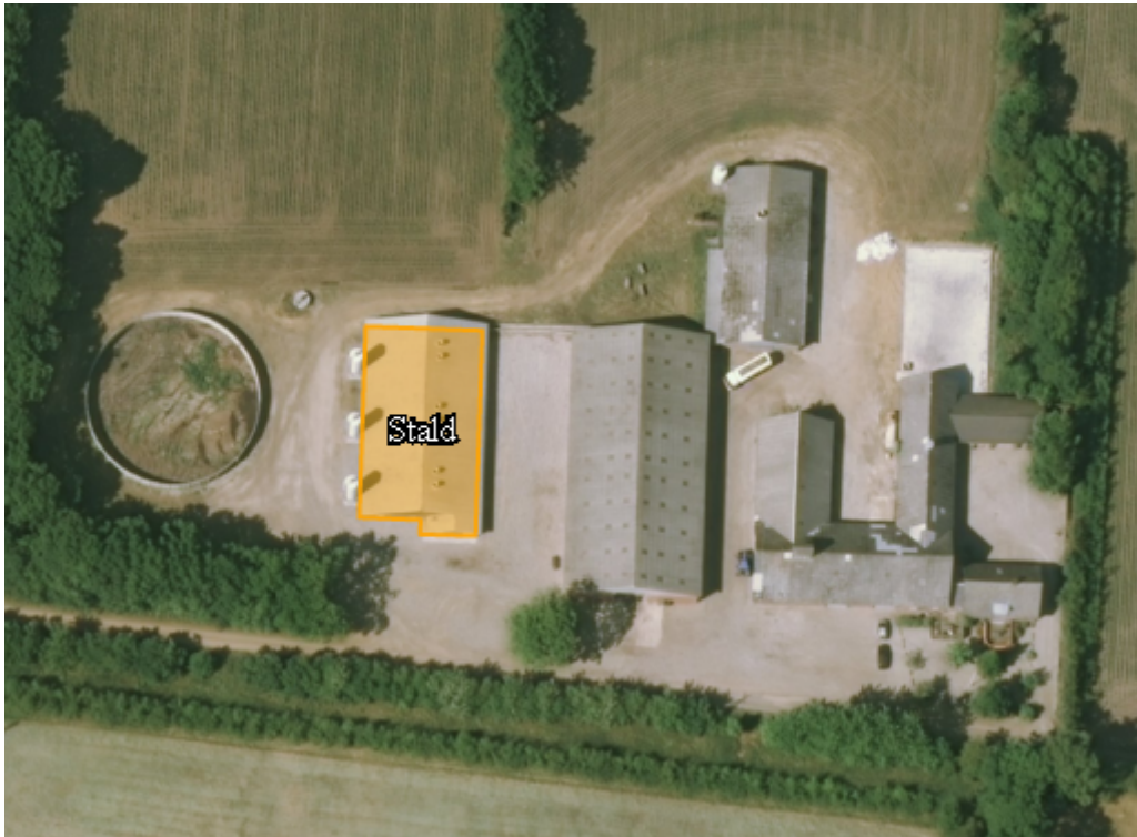
Figur 1: Oversigt over staldanlæggets placering på Stadevej 19.

Jævnfør husdyrgodkendelsesbekendtgørelsens 2 § 15, stk. 3 skal antallet af dyreenheder, som ændringen omfatter i hvert staldafsnit, reduceres med mindst 50 % ved skift mellem dyretyper. I staldafsnittet "Stald", som fremgår af Figur 1, skiftes 13,4 DE smågrise (7,5-30 kg) ud med 6,7 DE slagtesvin (30-115 kg), hvorved reduktionskravet overholdes.