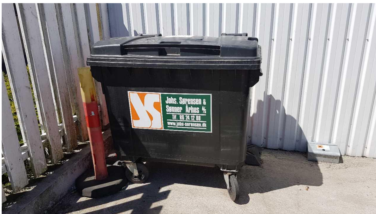
Container til brændbart erhvervsaffald.