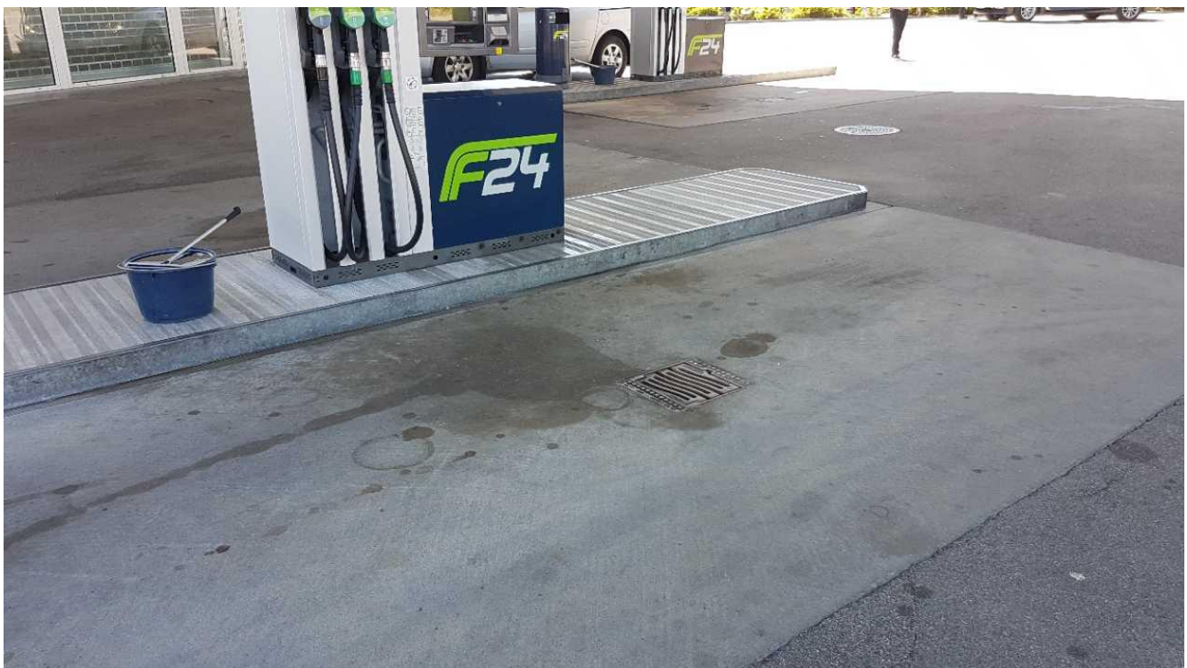
Belægningen ved salgspladsen.