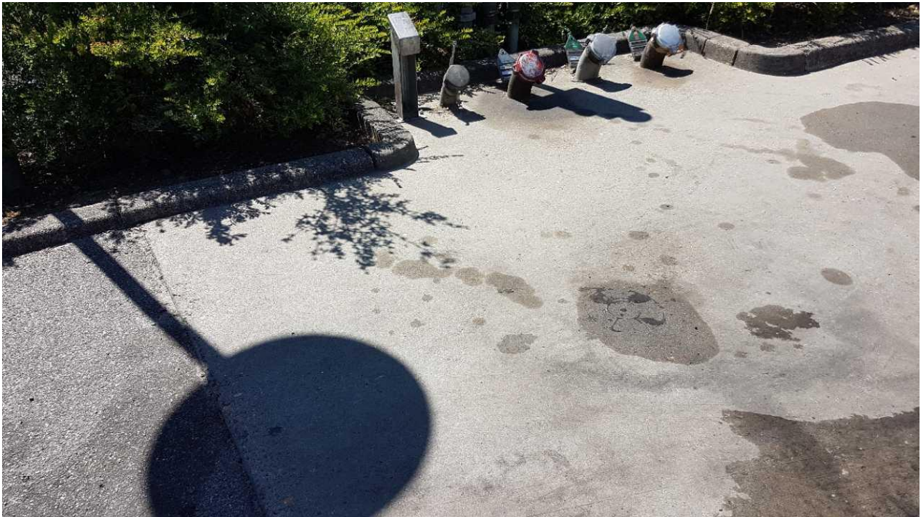
Belægningen ved påfyldningspladsen.