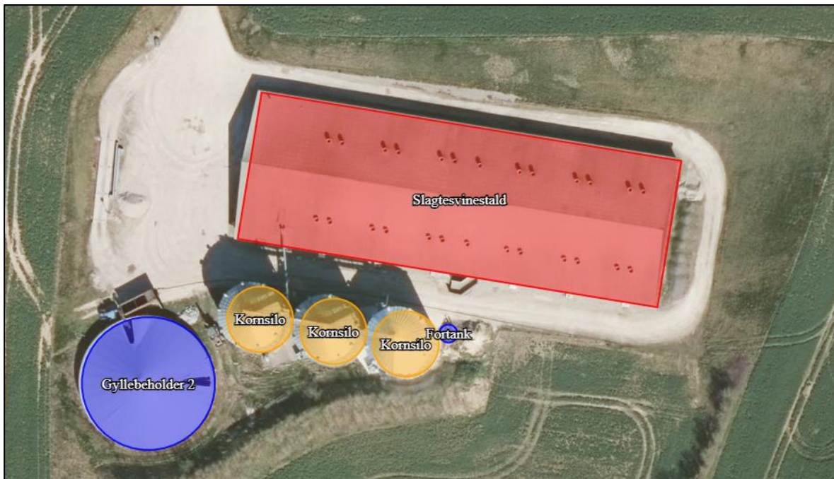
Figur 1: Oversigt over produktionsarealet (rødt) på Kirkvej 16, 5683 Haarby.

Der er søgt om husdyrgodkendelse til det eksisterende produktionsareal på Kirkevej 16, 5683 Haarby.