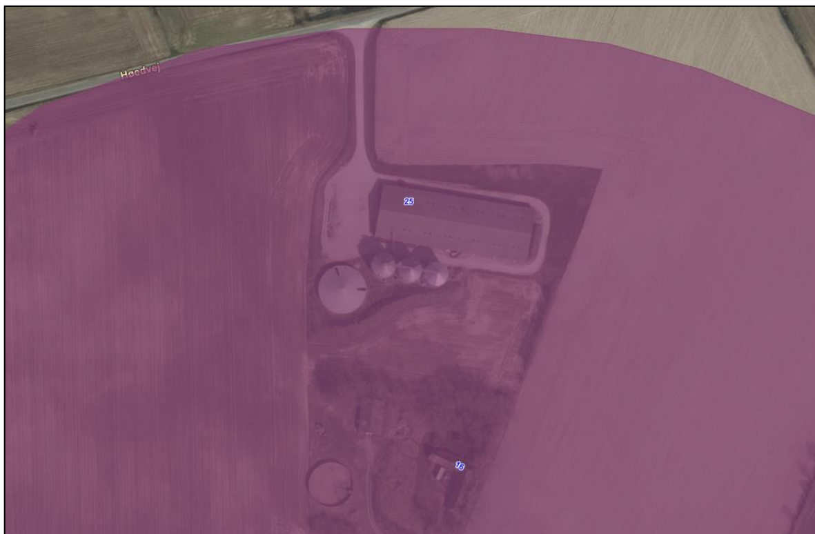
Figur 2: Oversigtskort over staldanlægget på Kirkevej 16 og kirkebeskyttelsesområdet.

Dreslette kirke er beliggende ca. 400 m. fra staldanlægget. Staldanlægget på Kirkevej 16 er derfor placeret inden for beskyttelseslinjen "kirkebeskyttelsesområde" - Se figur 2.