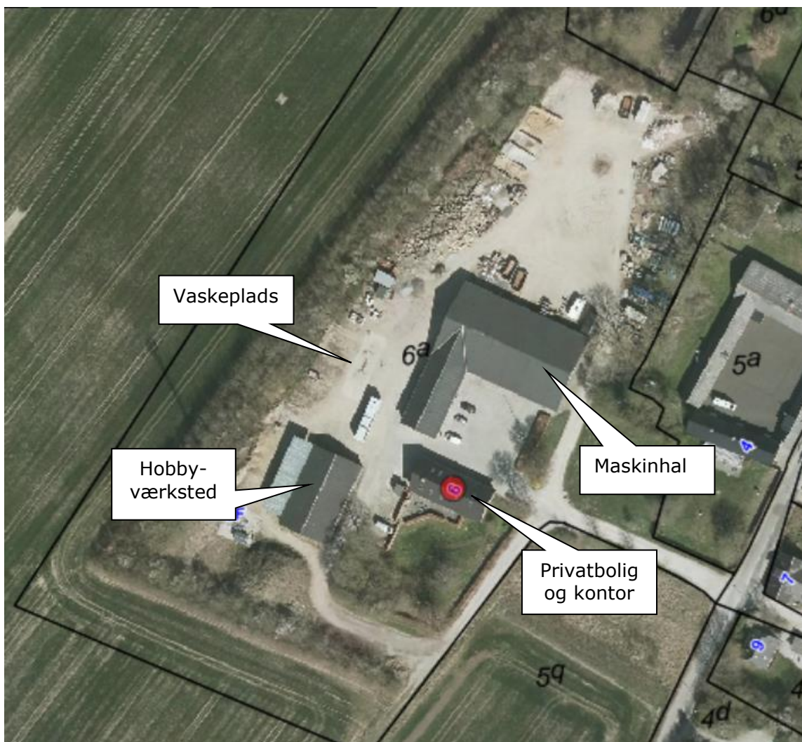
Luftfoto af virksomheden med matrikelskel

Virksomheden ligger i det åbne land i udkanten af Geding By. Virksomheden er beliggende inden for områder med særlige drikkevandsinteresser og inden for indvindingsoplandet til vandværket Kastedværket, der forsyner det midt- og nordlige af kommunen. Nærmeste nabo-bolig er stuehuset til nabogården, der ligger i en afstand af ca. 40 meter fra virksomheden.