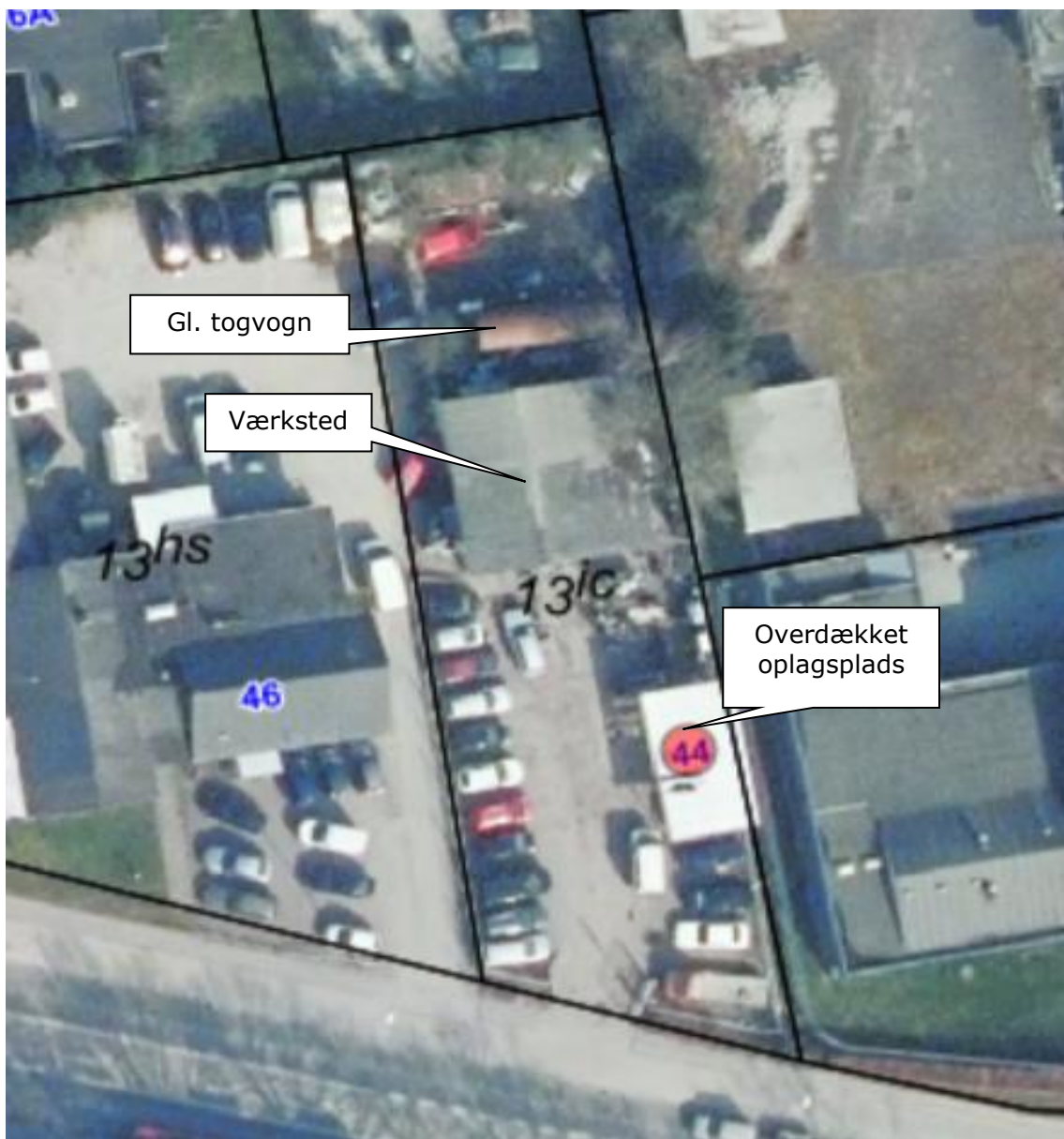
Luftfoto af virksomheden med matrikelskel anno 2022

I forhold til kommuneplanen ligger virksomheden i erhvervsområde 240504ER.