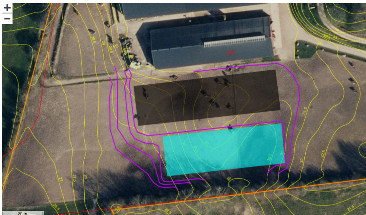
Kort 2: Kort med forventede nye koter efter etablering.

Askov Ridecenter er et erhvervmæssigt hestehold med rideskole og hestepension ved Askov Huse. I februar 2021 har centret fået mulighed for at bygge en lade og etablere stald i en tidligere lade – så der i alt vil være plads til 65 heste. Nu ønskes en ekstra ridebane på 60 m x 20 m etableret som en del af dyreholdet samtidig med, lige syd for og parallelt med den nyligt tilladte lade. Ridebanen etableres med opbygning i grus og et lavt hegn. Ridebanen er indtegnet med turkis og laden med sort på kort 2.