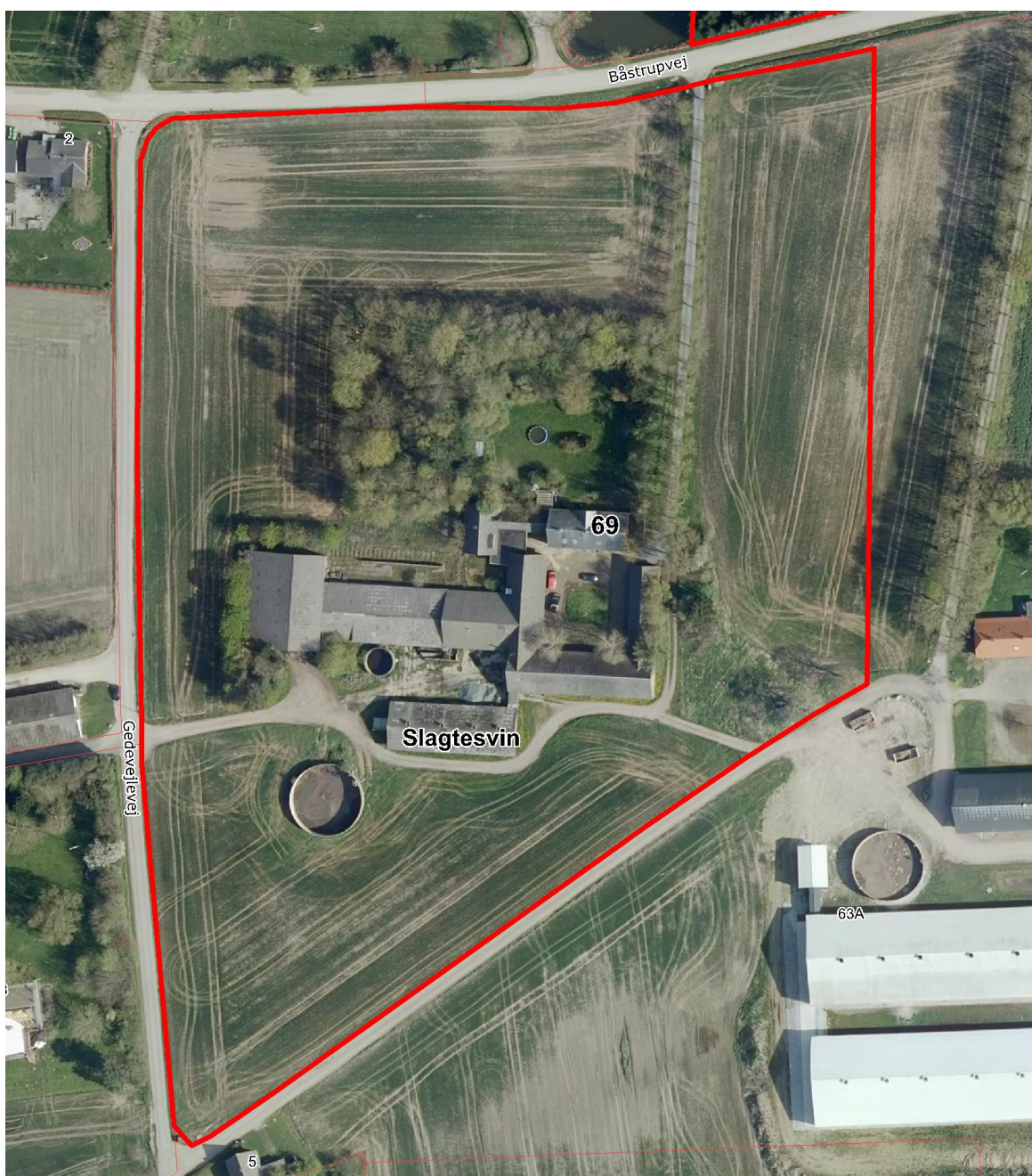
Luftfoto 2016