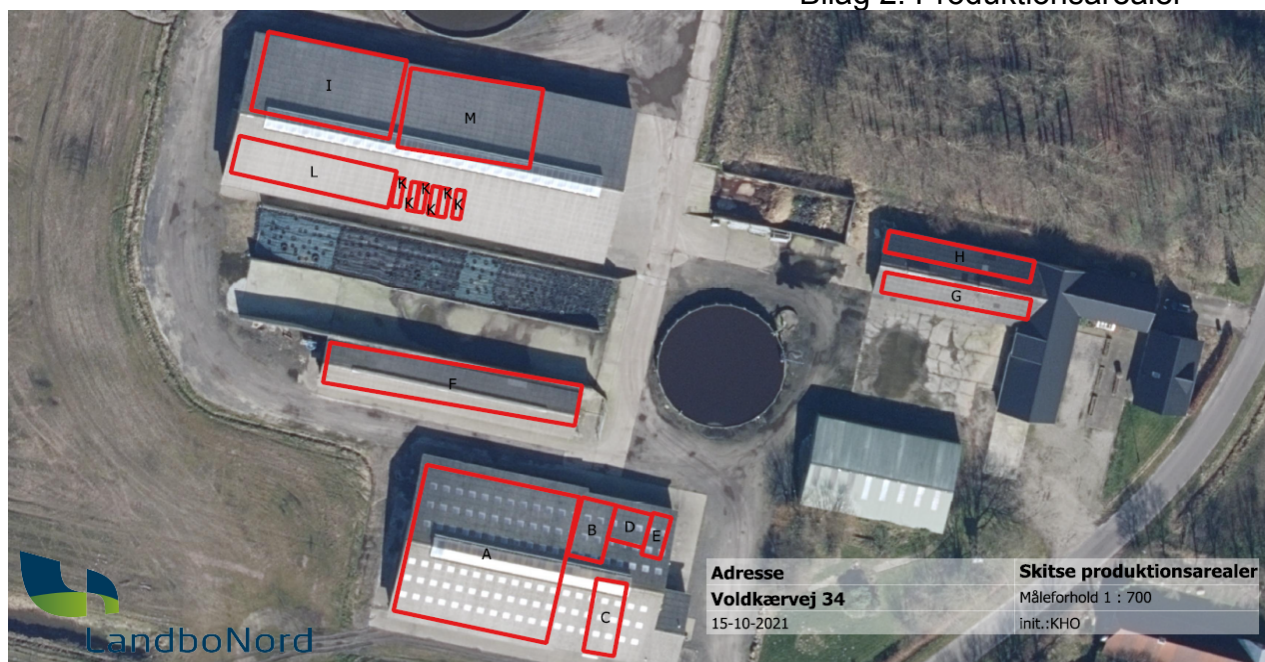
Figur 2: Placering af produktionsarealer i staldafsnit.