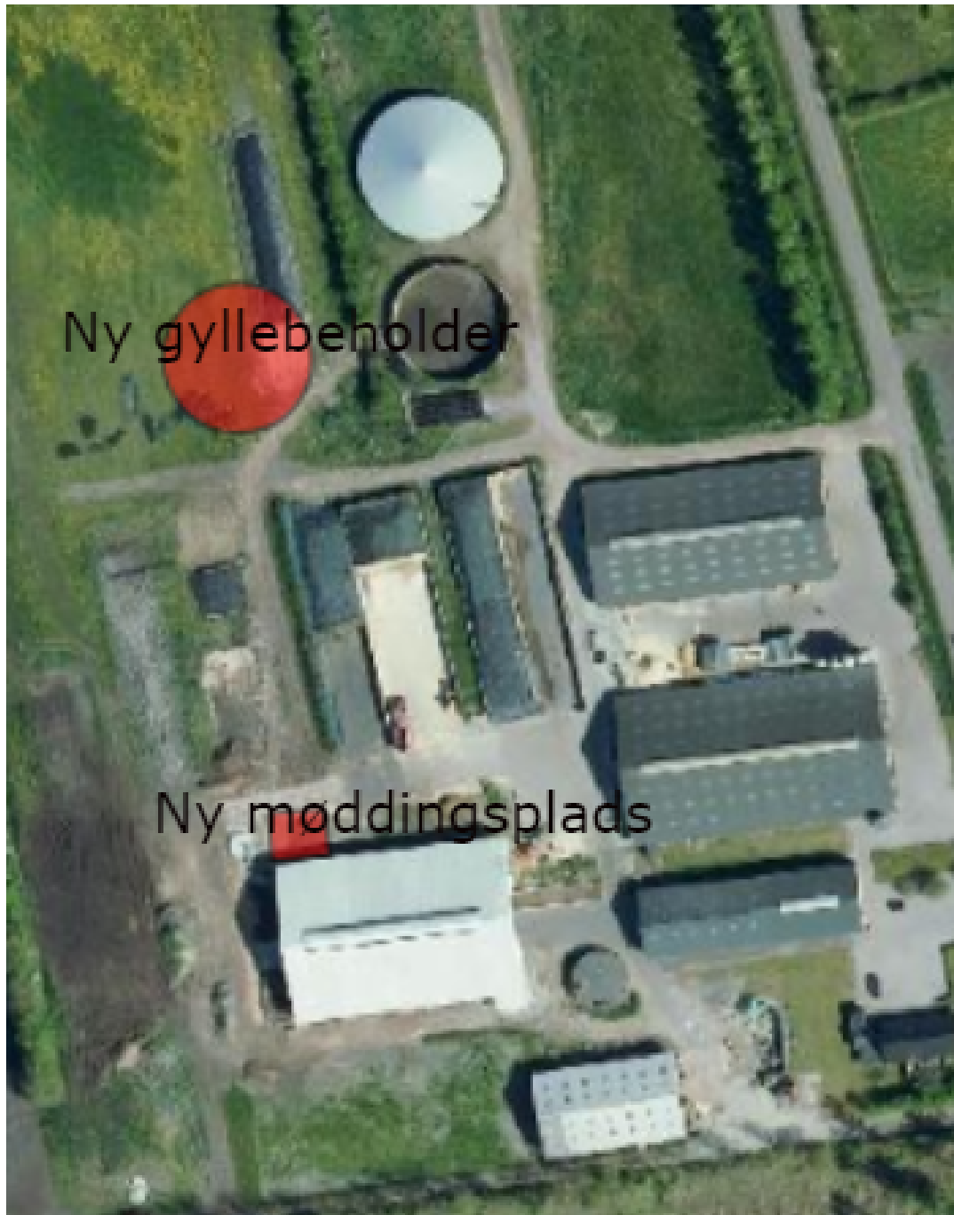
Figur 1: Placering af nye anlæg.

Oplysninger om ejendommens indretning og drift fremgår af tillæg nr. 1 fra 2021. Herunder er alene anført den nye gyllebeholder og den nye møddingsplads.