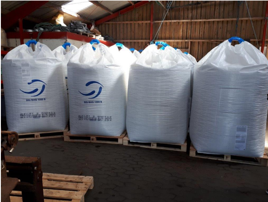
Opbevaring af foder i hal på Agersø Havn.