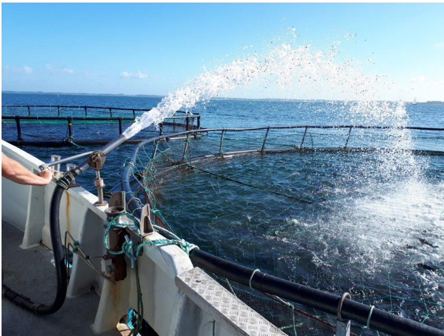
Fodring af fisk.