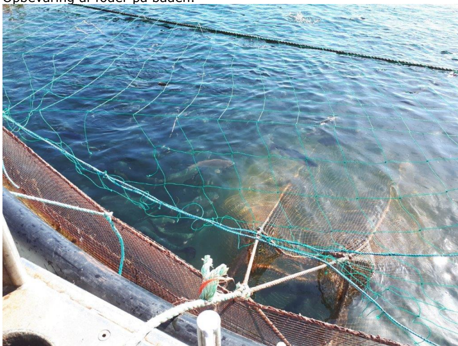
Net til opsamling af døde fisk.