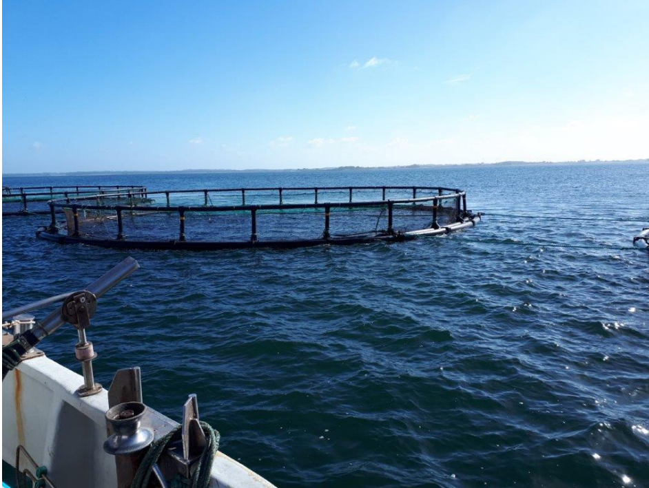
Havbruget set fra Agersø siden.