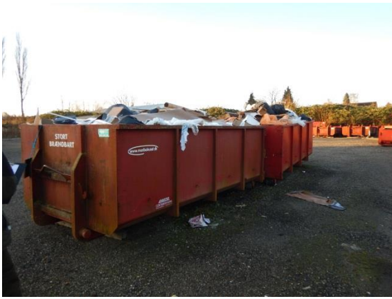
7. Blandet byggeaffald til sortering.