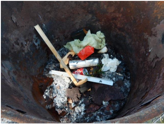
9. Indhold i afbrændingstønder.