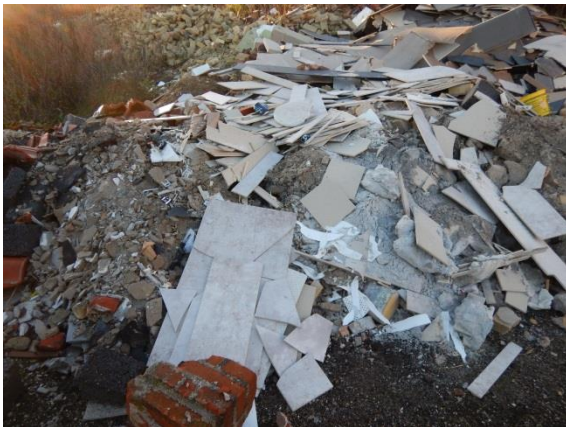
11. Byggeaffald, hvoraf en del ikke er omfattet af restproduktbekendtgørelsen.