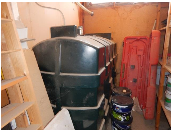
3. TITAN Plastiktank med fyringsolie.