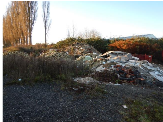
12. Byggeaffald, hvoraf en del ikke er omfattet af restproduktbekendtgørelsen.