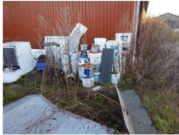
10. Malingsaffald opbevaret udendørs.