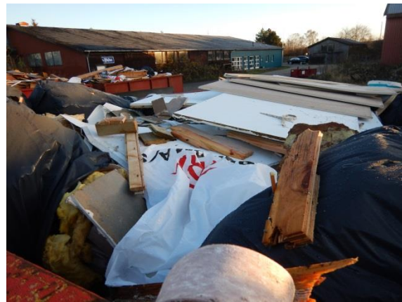
6. Blandet byggeaffald til sortering.